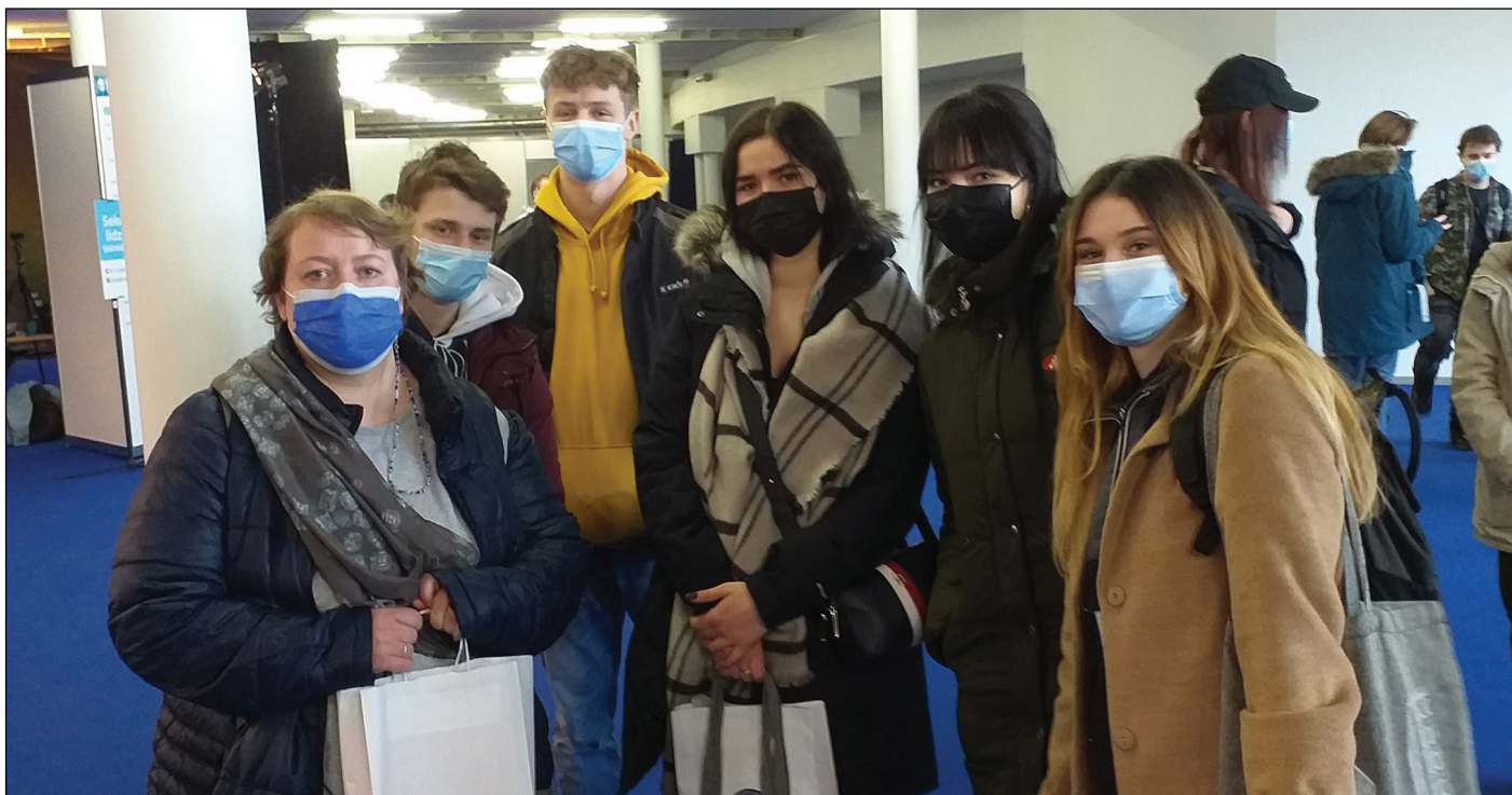
Skolēni izstādē “Skola 2022”