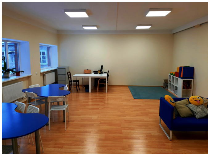
2021.gadā Keipenes pamatskolā tika veikti lieli remontdarbi. Attēlā pa kreisi - meiteņu mājturības kabinets, attēlā pa labi - pagarinātās grupas kabinets - abi pēc remonta.