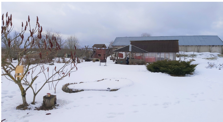
Daļa no Smiltnieku fermas ēkām šajās februāra dienās. Paši saimnieki ne par ko nebija pierunājami nofotografēties.

tikai mēs - arī citi Keipenes zemnieki uzticējās, paciegti gaidīja, kad tiks samaksāts par nodoto pienu, bija saprotoši, kad uzņēmējs sūdzējās par īslaicīgām grūtībām, bet rezultātā tika apkrāpti, atstāti bez ievērojamām naudas summām. Uzņēmējs vēl pasludina maksātspēju vai likvidē uzņēmumu, un tu neko no viņa vairs nedabūsi, jo viņam arī nekā vairs nav.