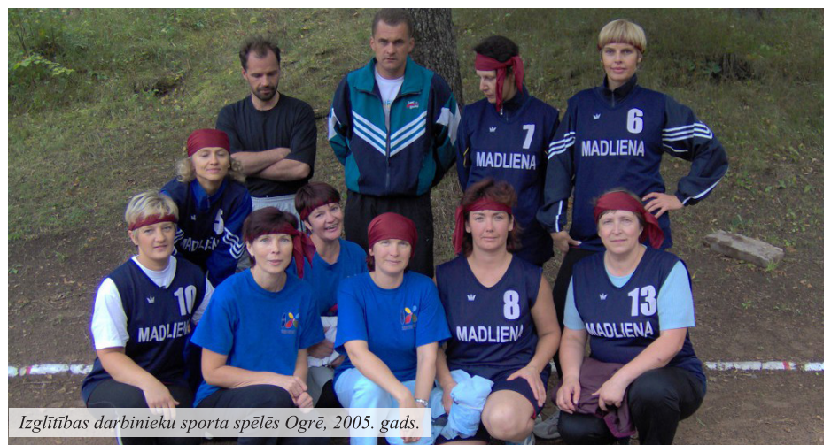
Izglītības darbinieku sporta spēlēs Ogrē, 2005. gads.

Siltums ielīst dvēselē, kad atminos skaistos mirkļus skolas sporta, vēlāk aktu zālē, kur kopīgi iedzīvināts kāds no scenārijiem – Žetonu vakaram, Ziemassvētku uzvedumam, valsts svētkiem vai Mātes dienai. Kur nu vēl Valodu nedēļas pasākumi, Dzejas dienas, ieskats autoru dzīves un daiļrades lauciņā. Vienmēr blakus bija komanda, kas rūpējās par mūziku, telpas dekorēšanu, zāles tīrību un gaismām. Es pat nevaru nosaukt visus, kas šajos garajos gados to darījuši, jo to ir simti, bet pleca sajūta, atbalsts un sapratne nekur nepazūd pat tagad. Arī skolas jubilejas pasākumi, absolventu salidojumi – neviens no uzrunātajiem man neatteica, visi piekrita – gan skolotā-