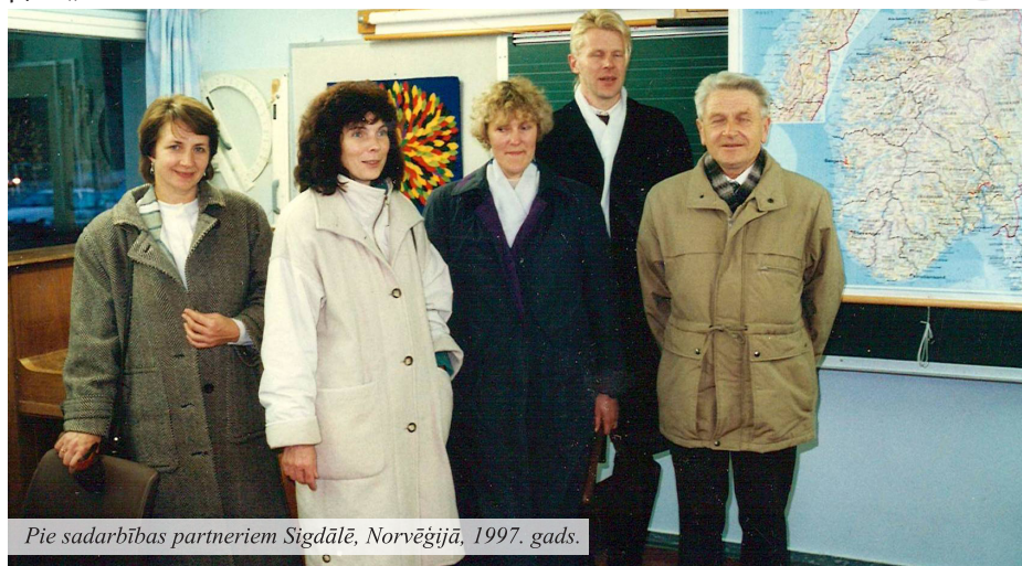
Pie sadarbības partneriem Sīgdālē, Norvēģijā, 1997. gads.