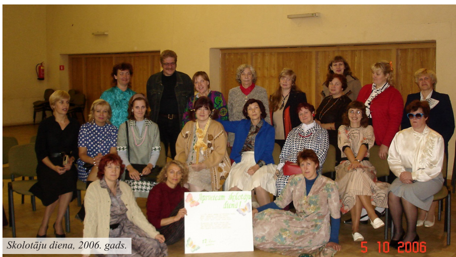
Skolotāju diena, 2006. gads.