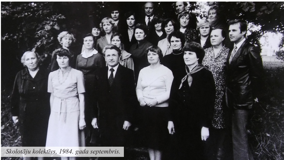
Skolotāju kolektīvs, 1984. gada septembris.

Madlienas vidusskolas jubilejas gadā turpinām atskatīties uz skolas vēstures gaitā paveikto, izdarīto un īpašu paldies sakām skolotājiem, kuri mācību iestādē nostrādājuši daudzus gadus. Viņu atmiņas ir vislabākie vēstures stāsti par to, kā katrs uzsāka darba gaitas Madlienas vidusskolā, cik neatlaidīgi un dedzīgi ir strādājuši, kā iemilējuši skolu. Katram savas atmiņas, kurām tikai jānotrauc putekļi, un skolas agrākā ikdienas izgaismojas īpašās krāsās.