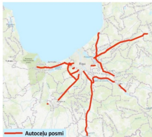
1. attēls. Valsts autoceļu posmi, kuriem tiek izstrādāts rīcības plāns, novietojums

Ilustrācijai izkopējums no “Rīcības plānu vides trokšņu samazināšanai valsts autoceļu posmiem 2019.-2023.gadam”