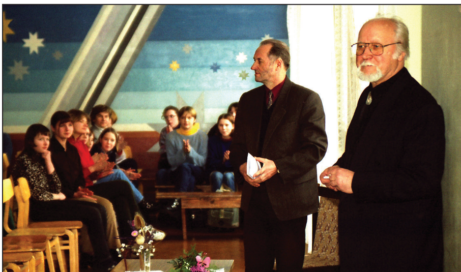
Jānis Streičs, viesojoties Suntažu vidusskolā 1999. gadā

Jūsu Jānis Streičs no Paliepa ciema Lietuvā