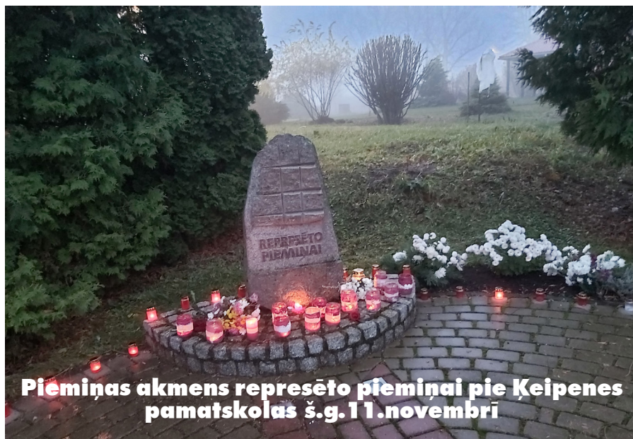
Piemiņas akmens represēto piemiņai pie Ķeipenes pamatskolas š.g. 11.novembrī