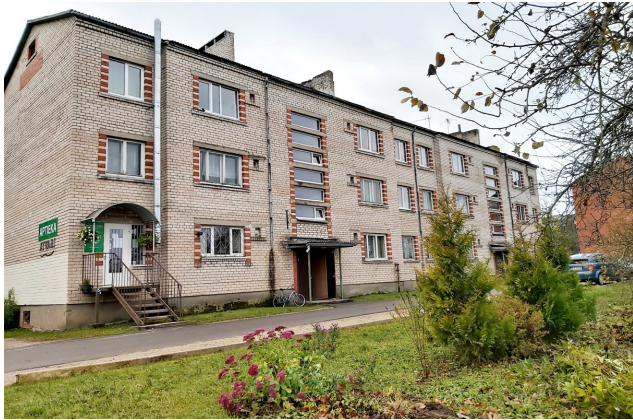
Atvari šajā rudenīgajā laikā