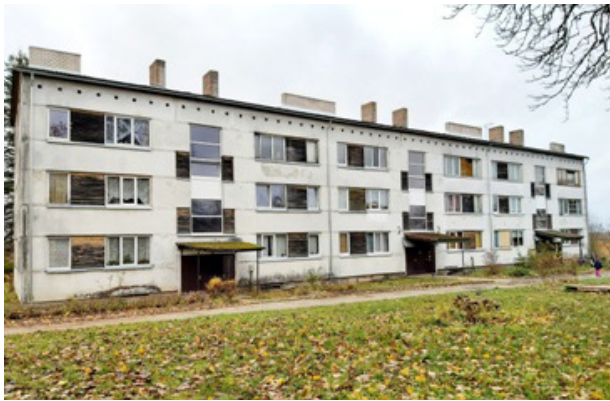
Daudzdzīvokļu māja "Kraujas"

Problēmas ir tādas, ka ir pāris cilvēku, kam visu vajag, bet naudu mājas apsaimniekošanai nedod. Nu tā arī cīnāmies!