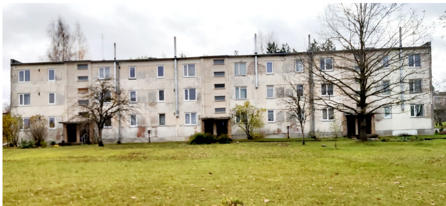
Akācijas ir viena no jaunākajām Ķeipenes ciema daudzdzīvokļu mājām

Problēma mājas apsaimniekošanā ir viena – visi dzīvokļu īpašnieki nemaksā apsaimniekošanas naudu un arī nepiedalās mājas apkārtnes sakopšanas talkās. No 18 dzīvokļu īpašniekiem apsaimniekošanas naudu nemaksā četri, nesen nemaksātājiem pievienojās vēl piektais nemaksātājs. Nu kā lai pārējie dzīvokļu īpašnieki, no kuriem lielākā daļa ir pensionāri, pavelk maksājumu slogu?