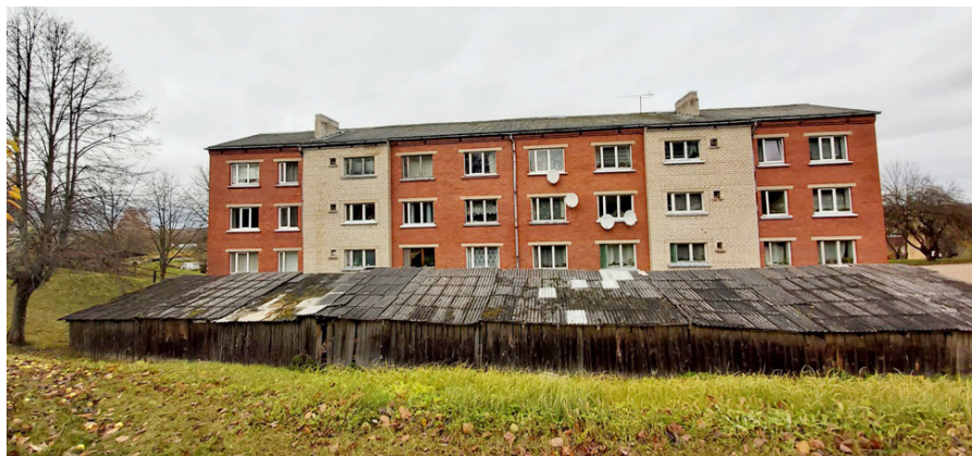
Vizbuļu māja no Akas ielas puses

Kā Ķeipenes ciema daudzdzīvokļu māju dzīvokļu īpašniekiem sokas ar māju apsaimniekošanu, jo no tā, cik veiksmīga ir mājas apsaimniekošana, atkarīga arī mājas energoefektivitāte, stāsta māju vecākie.