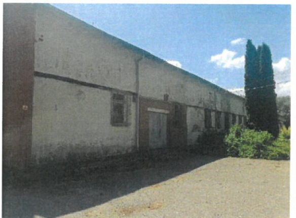
Skats uz vērtējamo objektu