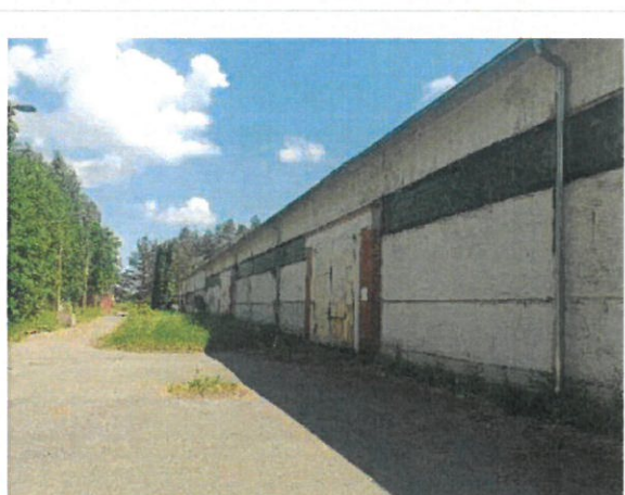
Skats uz vērtējamo objektu