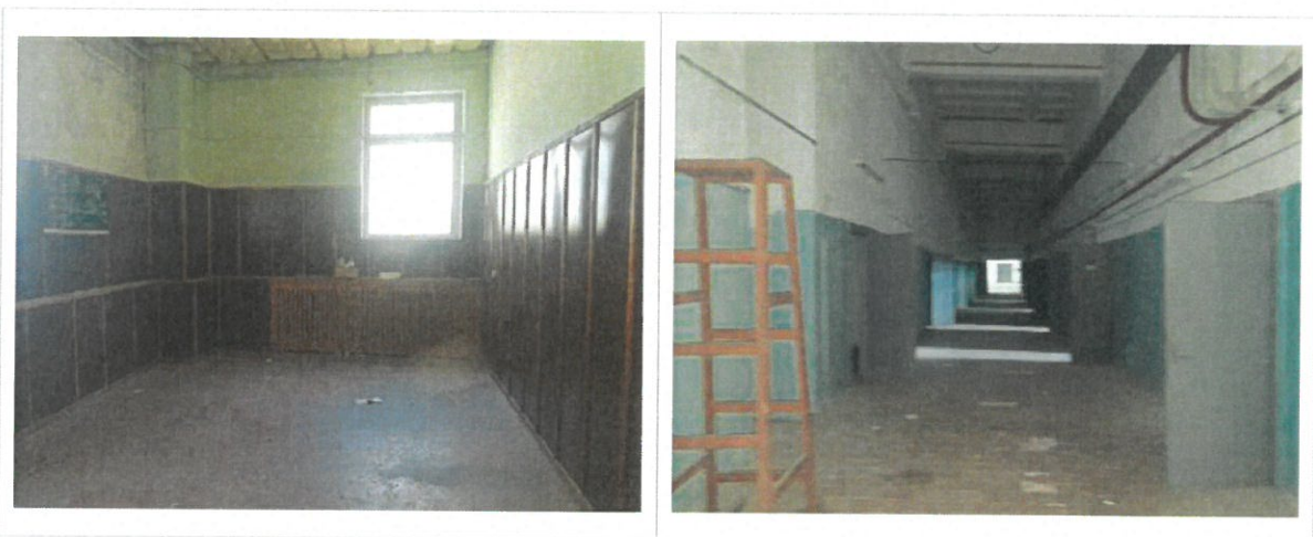
Noliktavas ēkas iekštelpas