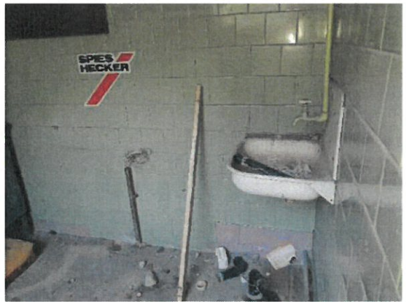
Noliktavas ēkas iekštelpas