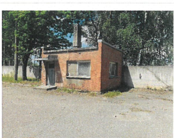
Skats uz caurlaides ēku