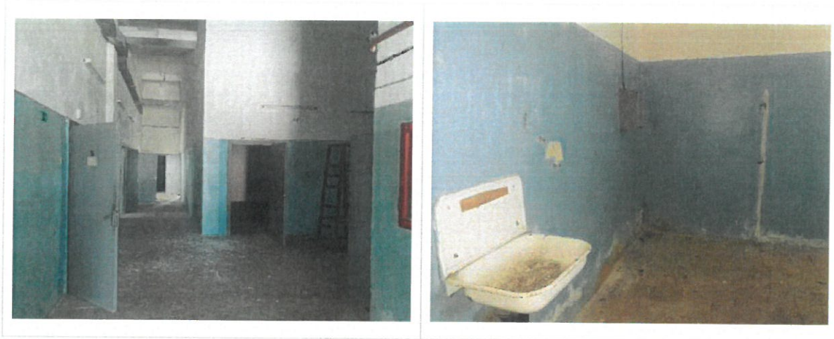
Noliktavas ēkas iekštelpas