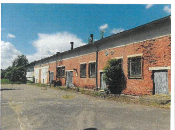
Skats uz vērtējamo objektu