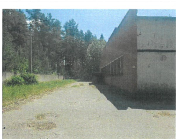
Skats uz vērtējamo objektu