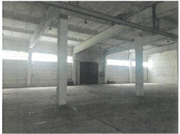
Noliktavas ēkas iekštelpas