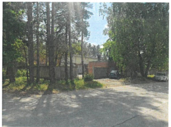
Skats uz vērtējamo objektu