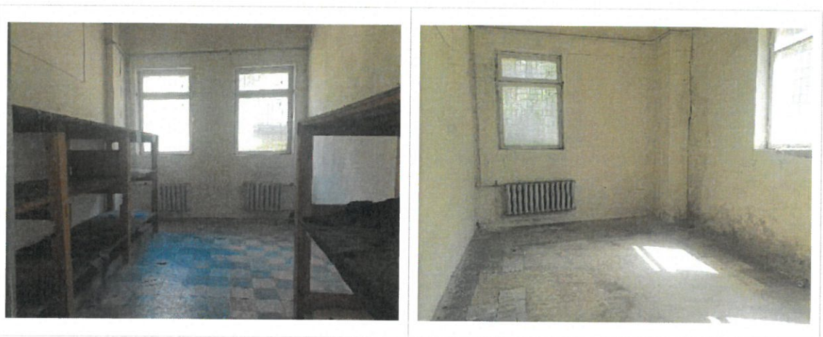
Noliktavas ēkas iekštelpas