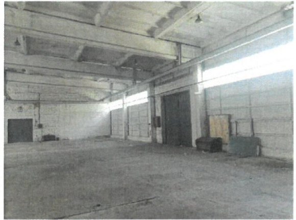
Noliktavas ēkas iekštelpas