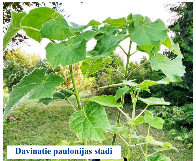
Dāvinātie paulonijas stādi