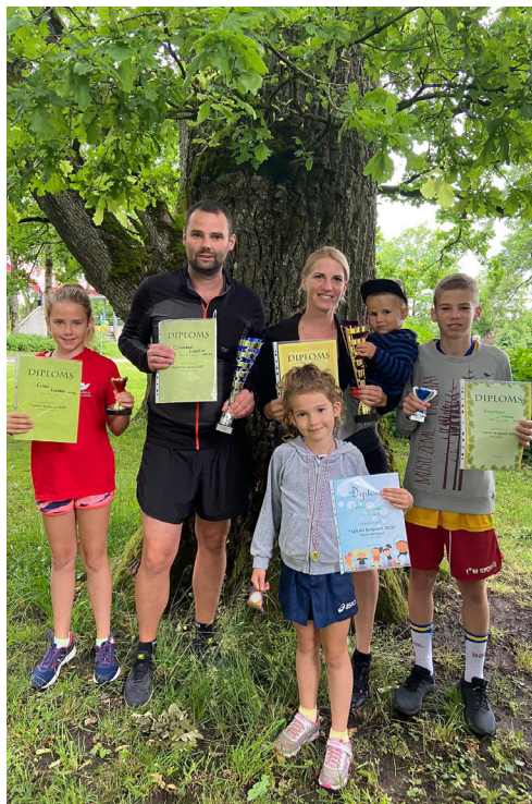
Ligeru ģimene Ķeipenes pagasta svētkos 2020.gadā. Šogad pagasta svētkos ģimenes pilnā sastāvā kópilde nav tapusi. Ķeipenes pagasta svētki ģimenē ir gaidīti, it sevišķi bērnu vidū.