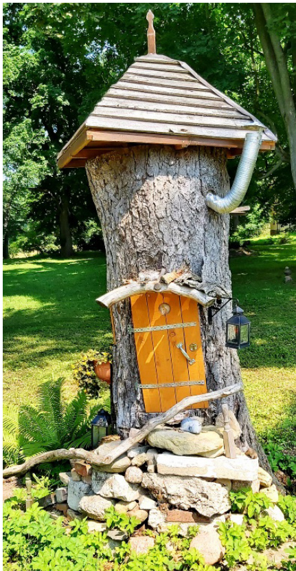
Peļu mājiņa Bauskas novada Gailītes pagasta Pamūšas ciemā

Vasarā apceļojot Latviju, ieraugām daudz ko skaistu un interesantu, kas liecina par mūsu cilvēku izdomas bagātību, radošumu un asprātību. Tas, ko ieraugām un par ko priecājamies, ir krāšņās puķu dobes, akmeņu, koku un dažādu sadzīves priekšmetu izmantošana ainavas veidošanā, savdabīgi māju nosaukumu veidojumi kokā, akmenī - esam tiešām izdomas bagāti. Nupat apceļojot Bauskas novadu, Gailīšu pagasta Pamūšas ciemā pie kādas mājas pamanīju šādu piemīlīgu peļu mājiņu. Jauka, vai nē?