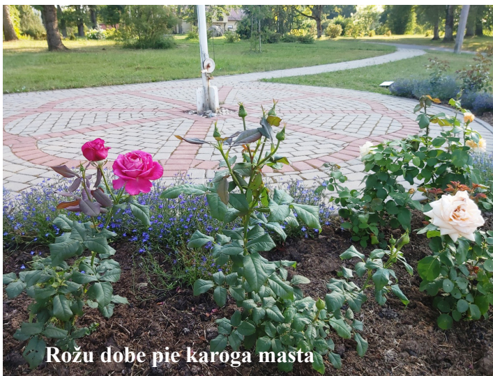
Rožu dobe pie karoga mastā