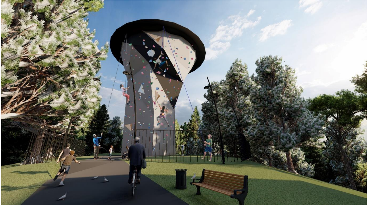
Attēls nr. 1