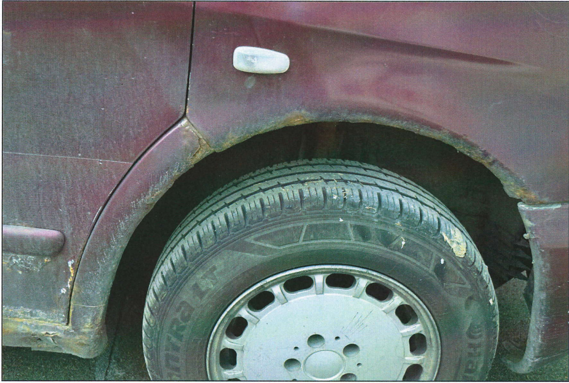
Labais priekšējais spārns