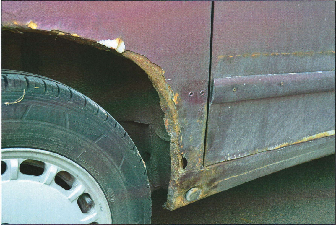
Labais aizmugurējais sliekšnis