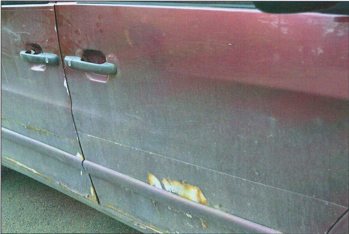
Labās priekšējās durvis