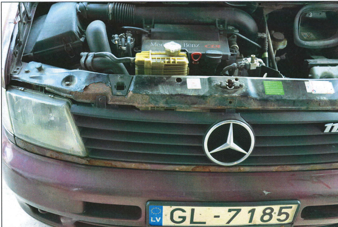
Dekoratīvā reste, moldings un motortelpas priekšdaļa