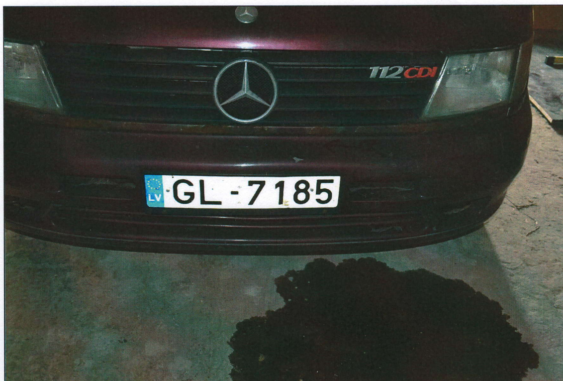
Dzesējošā šķidrums, eļļas noplūde