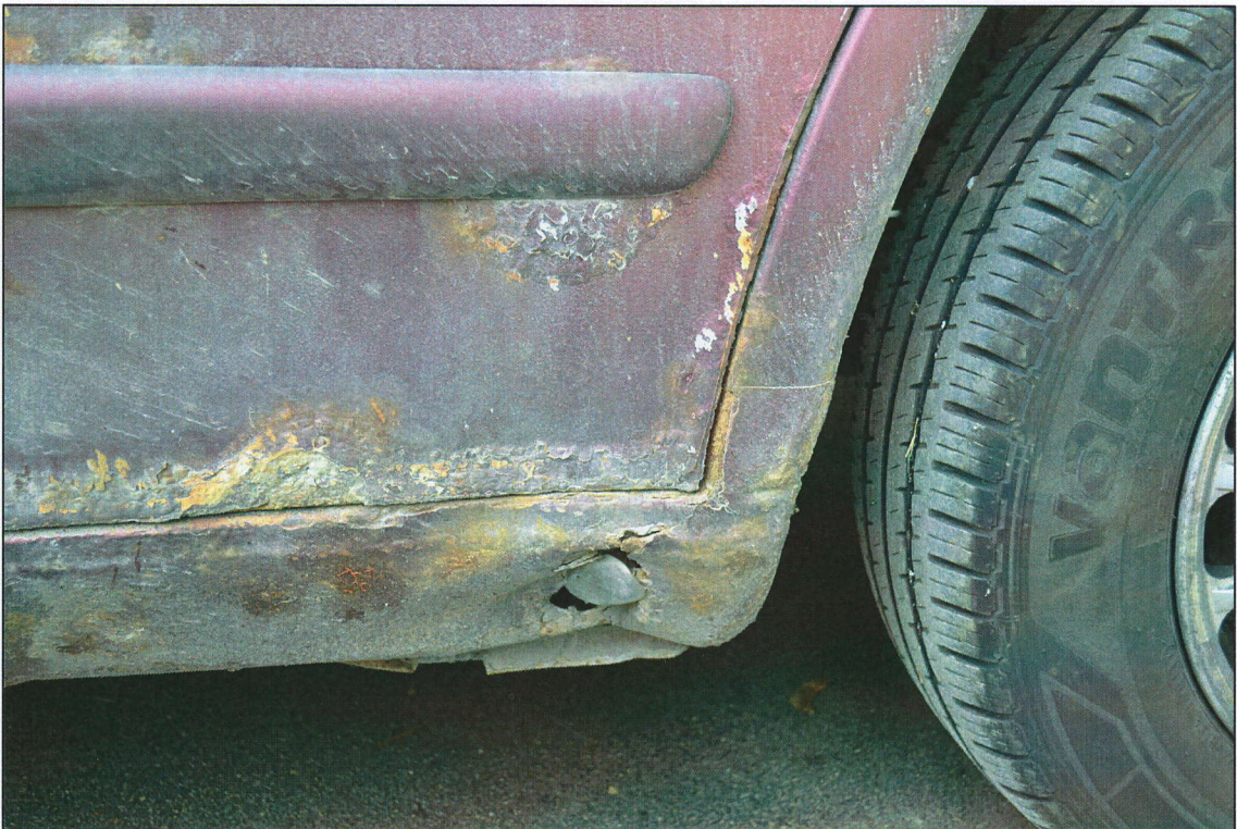
Labis priekšējais sliekšnis