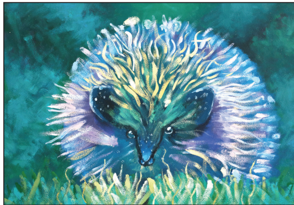
Lienes Gravās gleznojums