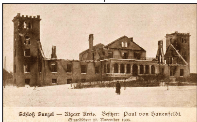
Nodedzinātā vecā pils