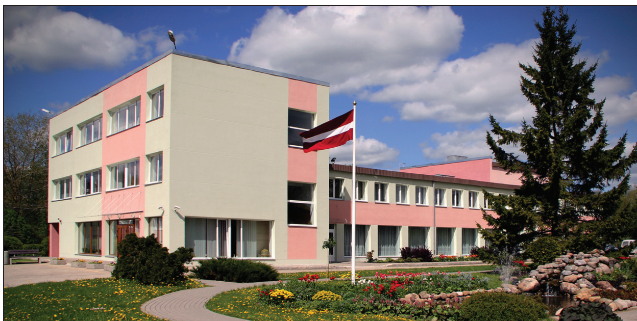
Suntažu kultūras nams