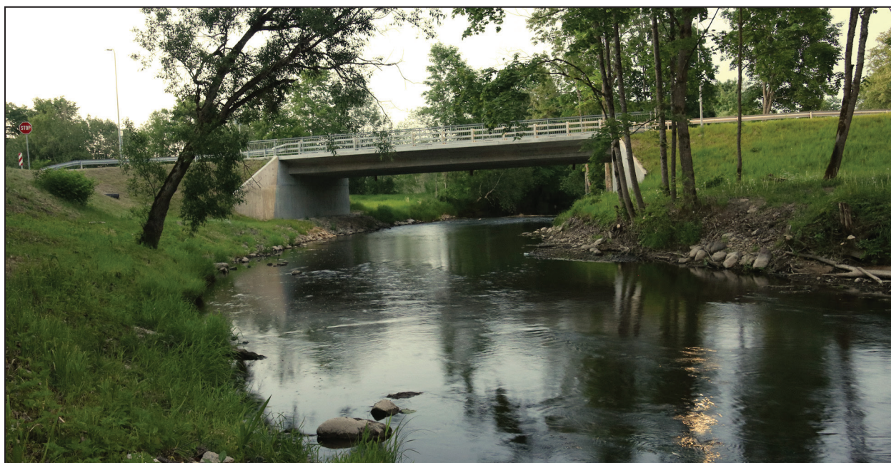
Jaunais tilts pār Mazo Juglu

2017. gadā uzcelts jauns tilts pār Mazo Juglu, saglabājot veco.