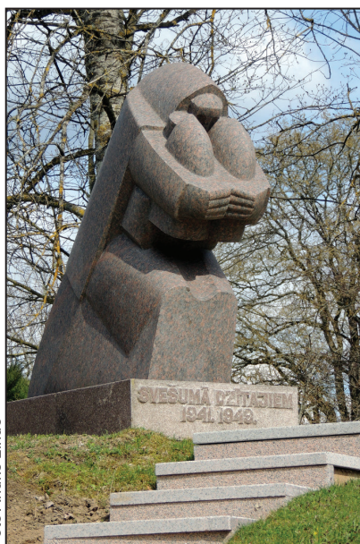
Piemineklis Svešumā dzītajiem