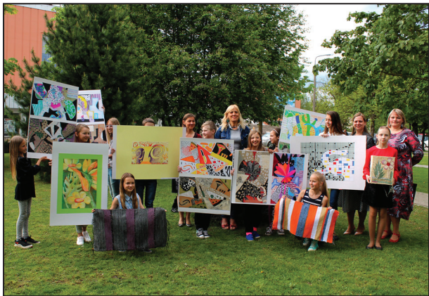
Daļa OMS absolventu 2017. gada maijā Ogrē

Līdz 2017.gadam mākslas skolas programmu Suntažos absolvējuši 39 audzēkņi