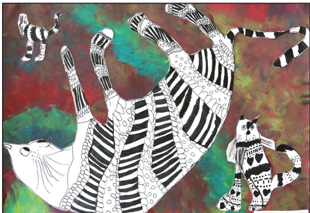
Karmenas Dzintares Čeirānes darbs