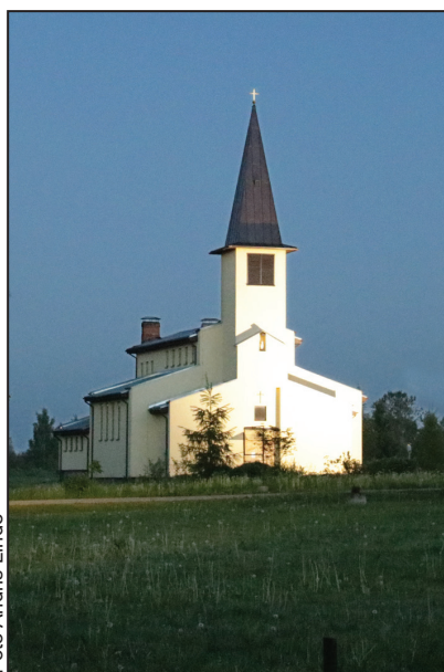
Romas katoļu baznīca