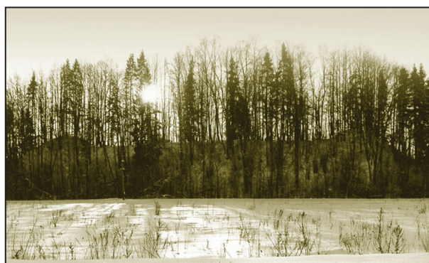
Lielā vīra gulta - Ķoderu pilskalns