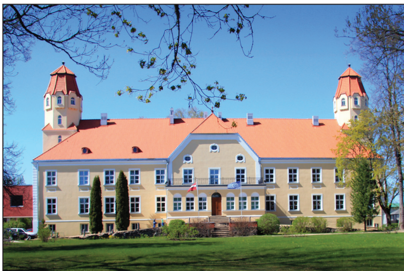
Suntažu pils šodien