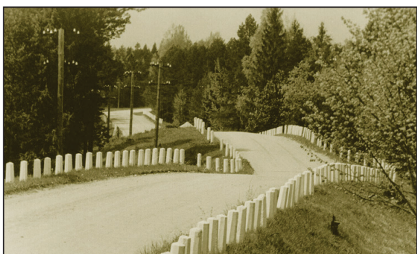
Ceļš cauri Kangariem. 20. gs. 60-tie gadi