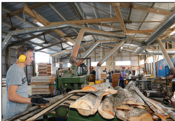
“Upeslīču” kokapstrādes cehā

“Latvijas Nacionālā naftas kompānija” - DUS; “Mednes Ozoli” - rūpniecības preču, apģērbu veikals; “Amola” - ēdināša, viesības, banketi, veikals; “Vegi” - veikals Rīts; “Lats” - veikals ar nodaļu “Mājai un dārzam”; “Kurmīšs” - veikals; “Saimnieks” - saimniecības preču veikals; “Frēzija” - ziedu salons; “Sajūtu dārzs” - viesu māja; “Copes” - viesu nams un piedzīvojumu parks “Alaska”; frizētava; “Mežvidi” - auto remontu darbnīca; pašvaldības aģentūra “Rosme” - komunālā saimniecība; Suntažu pasta nodaļa; ģimenes ārsta prakse; pediatra prakse; prakse zobārstniecībā; fizioterapeita prakse; veterinārārsta prakse; pagasta bibliotēka;