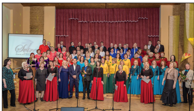
Ikgadējais vokālo ansambļu lielkoncerts 2018. gada 24. martā