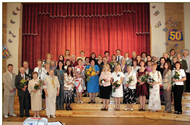
Skolotāji, darbinieki un viesi Sanatorijas Internātskolas 50 gadu salidojumā 2011.05.28.

Skolas vadība no 2004.-2011.gadam raksta projektus, tā piesaistot līdzekļus skolas remontiem – visu jumtu renovācija, guļamkorpusa renovācija ar pamatu siltināšanu, guļamkorpusa elektroinstalāci-