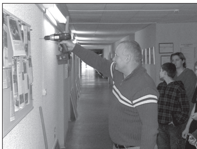
Ja māksla prasa, tad urbjam sienā!