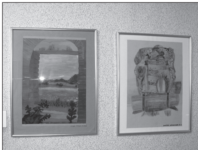
Vasaras krāsas, vasaras smarža...