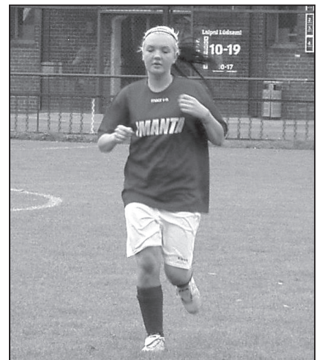
Lineta savu darbu izdarījusi, dodas uz nomaīņu