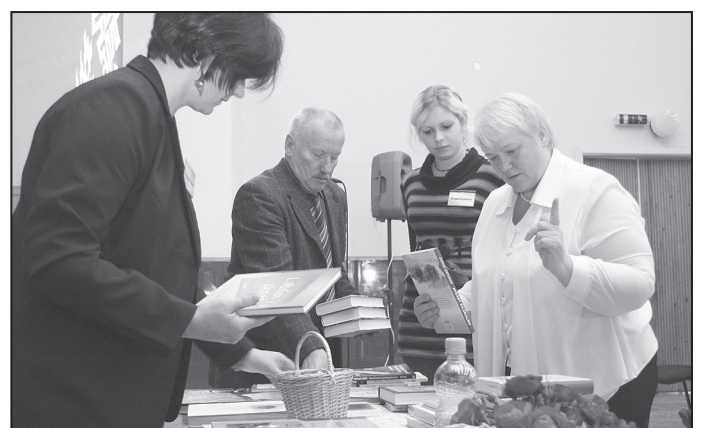
Grāmatu izloze svētku noslēgumā var sākties.