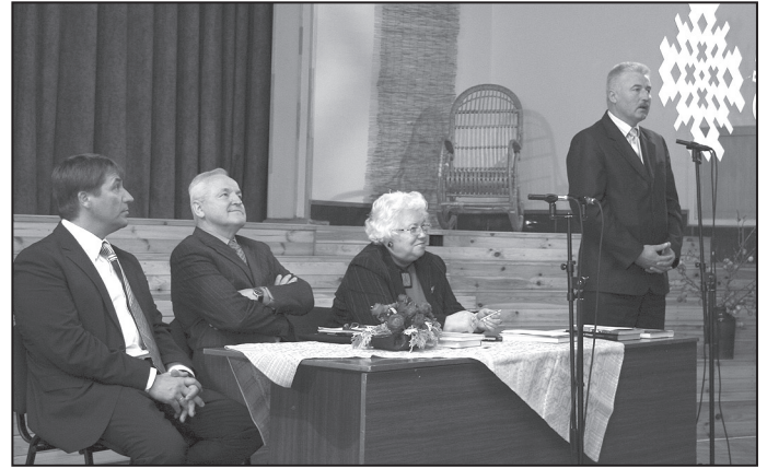
Diskusija par ES kopējo tirgu.