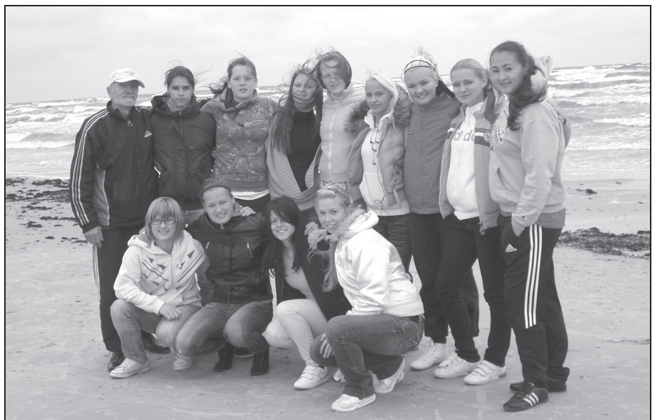
Liepājas pludmalē pirms spēles ar FK Liepājas Metalurgs