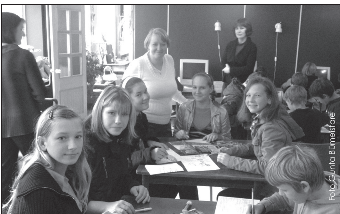
Radošajā darbnīcā sanatorijas internātpamatskolā.