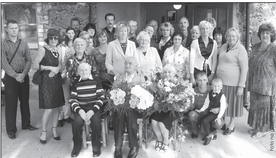
Radu un draugu pulkā dzimšanas dienas pasākumā

1950.gada 6.aprīlī apprecējos, 9. aprīlī Voldis aizgāja dienestā. 3,5