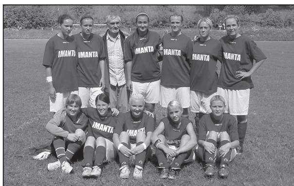
Sieviešu virslīgā pēc uzvaras Viesīvē ar 3-1. Vai var būt labāka dāvana dzimšanas dienā trenerim?