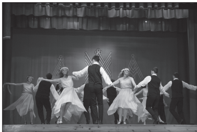
„Pastalnieki” no Ērgļiem