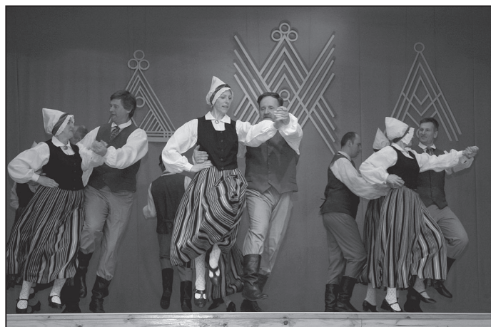
„Lustīgais” no Lauberes