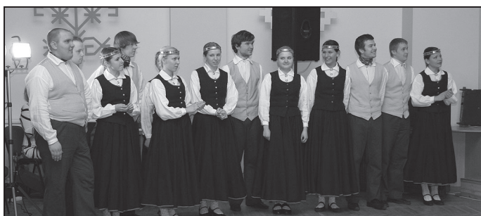
„Skalbe” no LLU