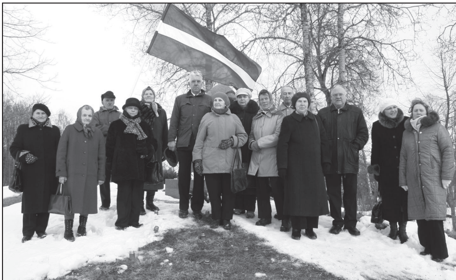
Pēc atceres brīža pieminēja kalniņā.