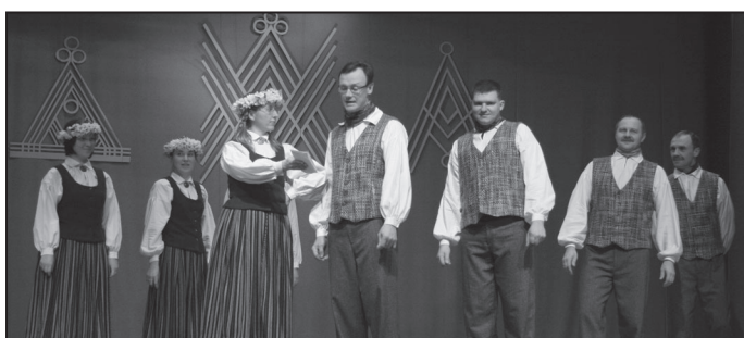
Matīšu pagasta dejojāji