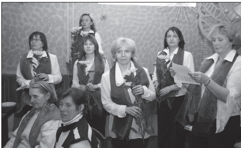
Vokālais ansamblis "Svīre" ar tālo gadu dziesmām.