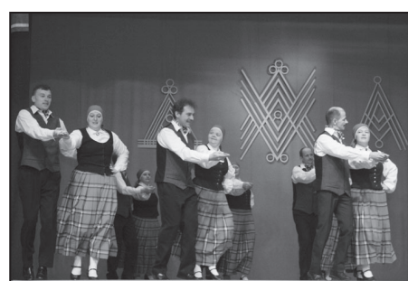
„Kriediņš” no Mālpils