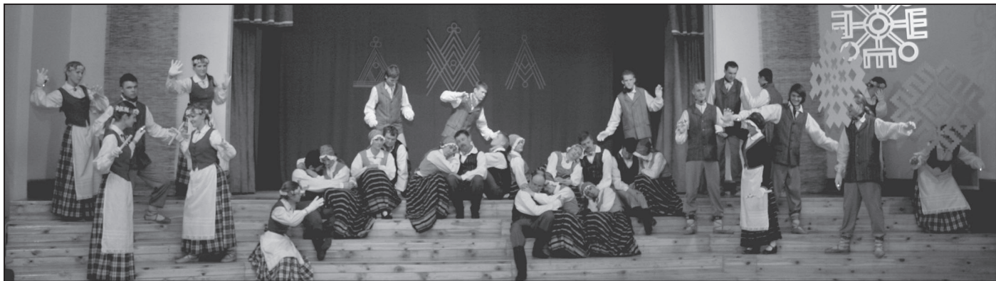
„Sunta” un „Spāre”

21. martā kultūras namā mūsu deju kolektīvi „Sunta” un „Spāre” sadancī „Kad mūsu nebija mājās” tikās ar draugiem.