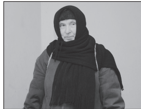
„Tādi mēs tur, Sibīrijā staigājām”

Skaudras atmiņas. Paldies vārdi par to, ka represijās cietušie Suntažu ļaudis nav aizmirsti un gadu no gadu piemiņas dienās tiek kopā aicināti. Un mazliet rūgtuma. Par to, ka šogad - 60 gadus pēc baisā 25. marta – šī tautas vēstures lappuse valstiskā mērogā tika pāršķirta tik klusi.