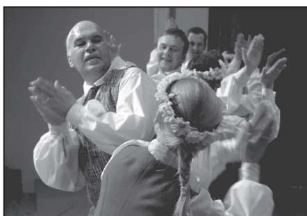
Mazsalacas pagasta dejojāji