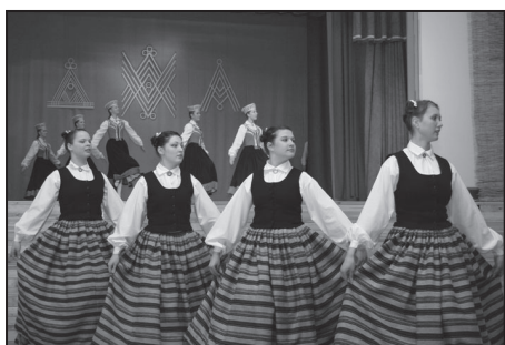
„Jumpraviņa” no Jumpravas