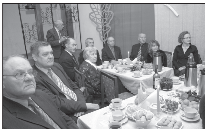
Biedrības “Zied zeme”valde un pārstāvji 16. janvāra pasākuma noslēgumā Suntažu kultūras namā.

Pasākuma organizators ir Rīgas plānošanas reģiona Eiropas Savienības struktūrfondu Informācijas centrs (Rīgas RSIC) sadarbībā ar VRG Publiskās Privātās Partnerības biedrību „Zied zeme”.