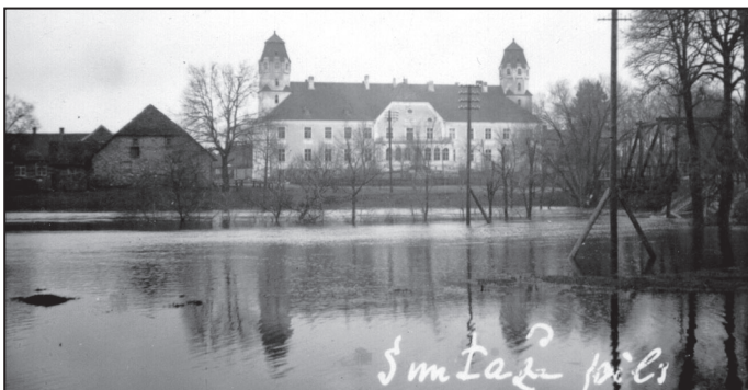
Suntažu pils. 1930. gada rudens.