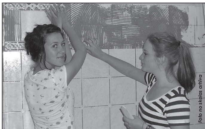
Draugi no Nīderlandes.