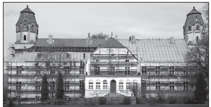
Suntažu pils. 2010. gada 5. jūnijs.