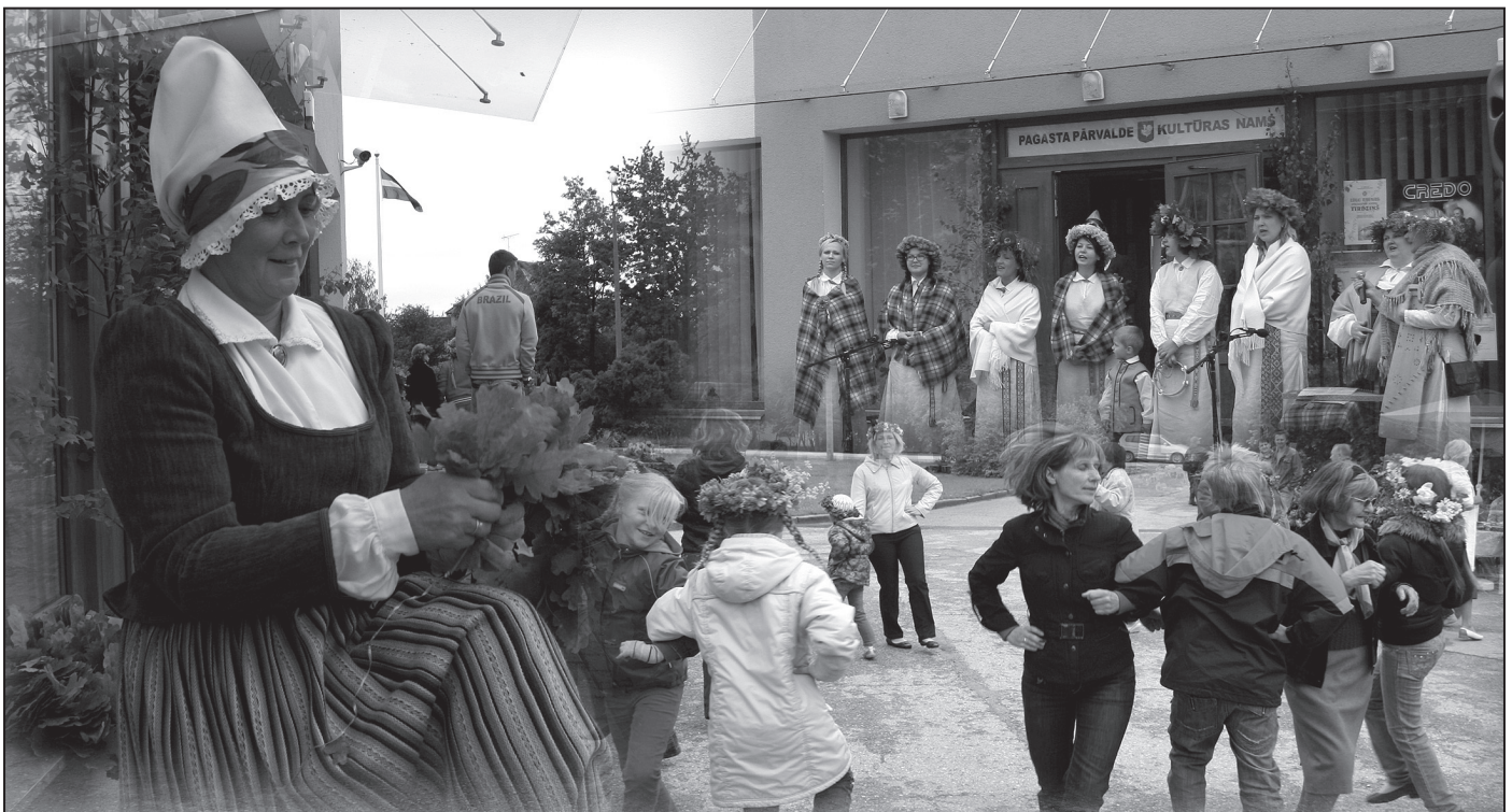
Līgo rītu Suntažos ieskandināja Jumpravas folkloras grupa un dejotāji.