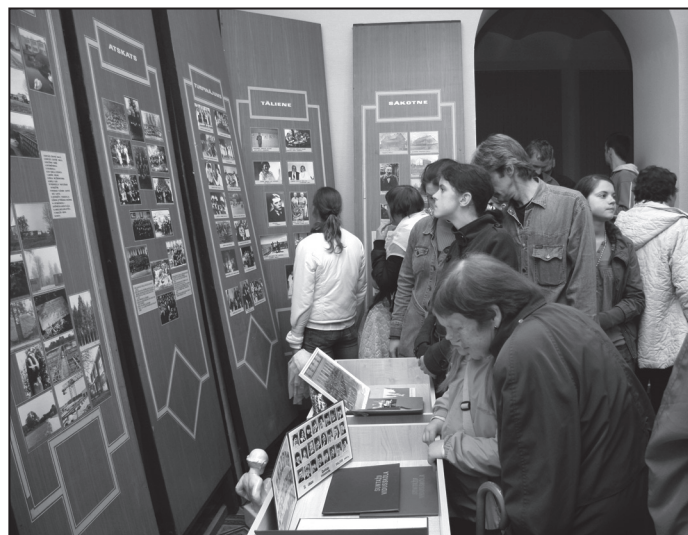
Suntažu pils muzejā.