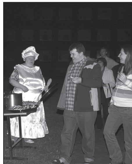
Barona ķēkšas ceptie pankoki ir varen gardi.

Uz āra lielā ekrāna bija iespēja skatīt senās Suntažu fotogrāfijas no muzeja fonda.