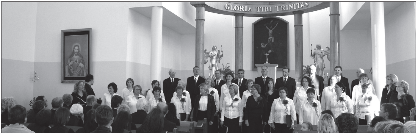
Suntažu katoļu baznīcā dzied koris „Suntaži”.

29. maijā Suntaži skanēja dziesmu un deju ritmos.