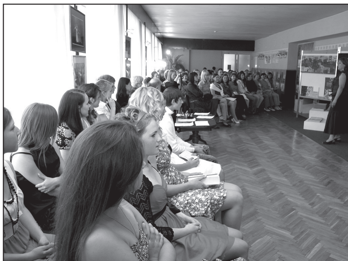
Diplomandi gatavojas darbu aizstāvēšanai.