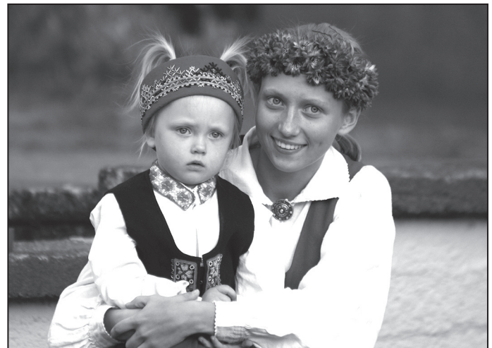
Svētku koncertā „Dod savu plaukstu man” dziedātpriekā un dejotpriekā dalījās visi svētku dalībnieki.