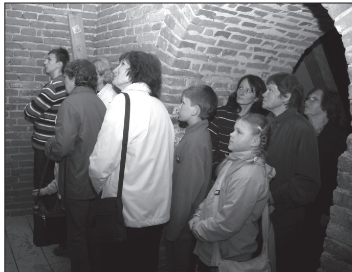
Suntažu Ev. Lut. baznīcas zvana tornī.