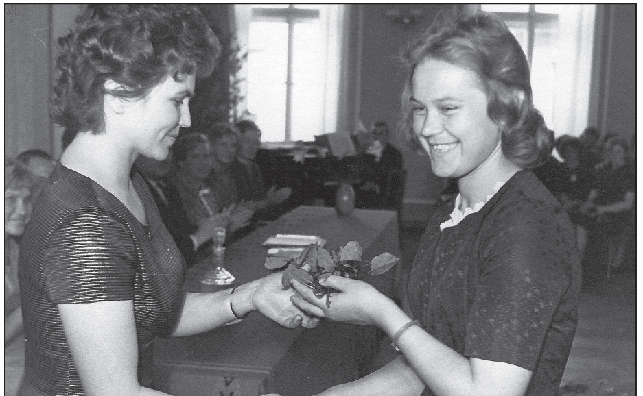
Izlaidums Liepājas Pedagoģiskajā institūtā. 30.06.1964.