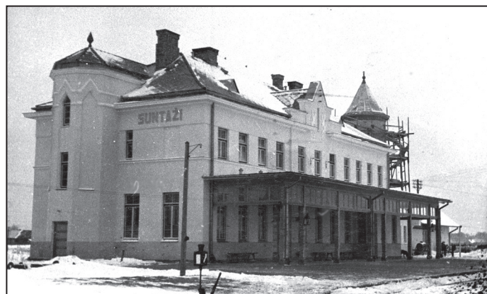
Suntažu stacijas ēka.