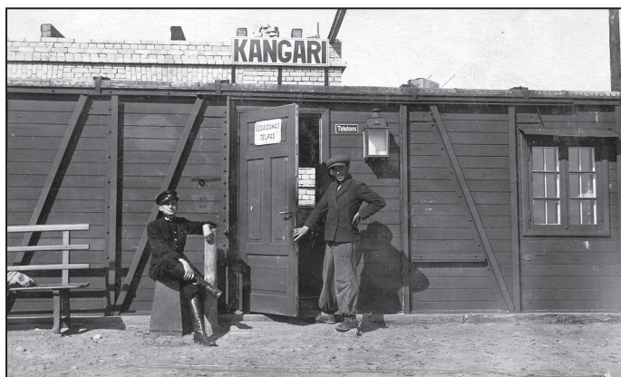
Kangaru stacijas vagoni. (Latvijas Dzelzceļa vēstures muzeja materiāli – LDzM_4283)

Kā jau varējām lasīt iepriekšējā pagasta laikraksta „Suntažnieks” numurā, dzelzceļlīnijas Rīga–Suntaži–Ērgļi pirmais posms līdz Suntažiem tika atklāts 1935. gada 26. novembrī. Uz to brīdi vēl nebija paspēts uzcelt visas dzelzceļa stacijas, gatava bija Jāņvārtu stacija. Divu gadu laikā, kad būvēja dzelzceļu līdz Ērgļiem, notika arī dzelzceļa ēku celtniecība. Līdz tam dzelzceļa stacijas funkcijas veica speciāli ierīkoti vagoni. Latvijas Dzelzceļa vēstures muzeja krājumos ir attēls ar šādu vagoniņu Kangaru stacijā.