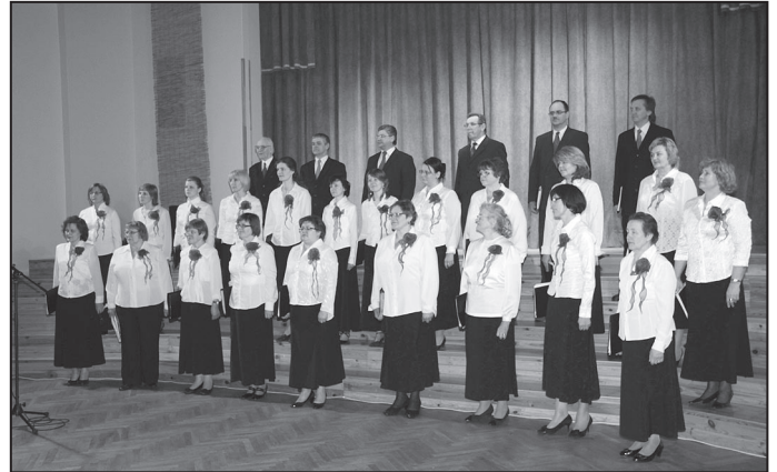
Jauktais koris „Suntaži”.