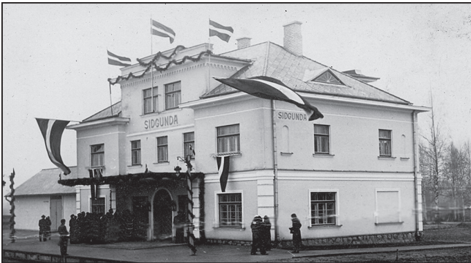
Sidgundas stacija

Tagadējā, vēl skatāmā Suntažu stacijas ēka ir