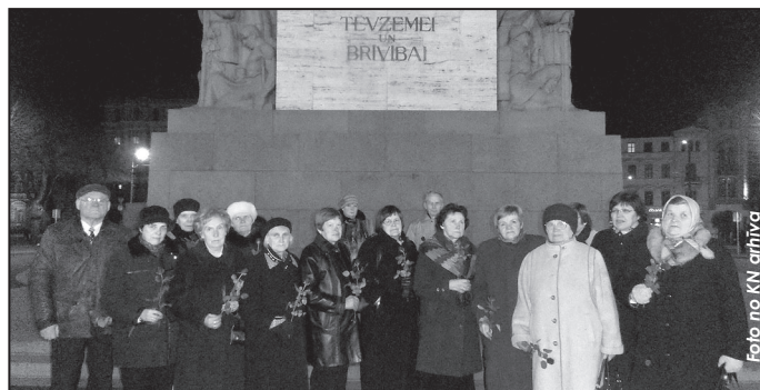
Vakarā, vēl izrādes noskaņās kavēdamies, suntažnieki nolika Brīvības pieminekļa pakājē ziedus.