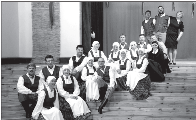
Vidējās paaudzes deju kolektīvs "Sunta".