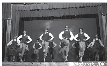
Suntažu vsk. JDK