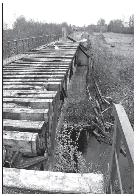
Dzelzceļa tilts. 02.11.2011.

Daudziem suntuļniekiem un citiem dzelzceļa līnijas