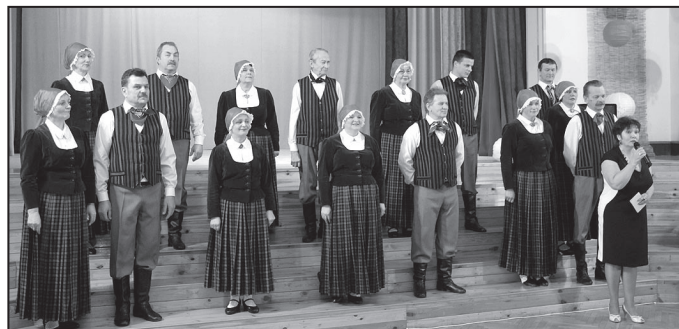
Senioru deju kolektīvs „Suncele”