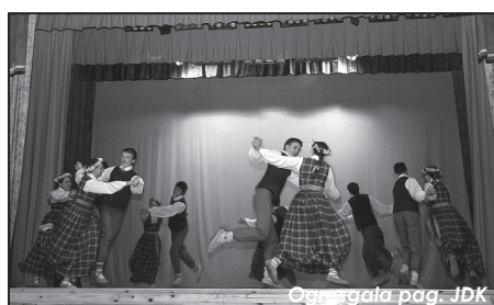
Ogresgala pag. JDK