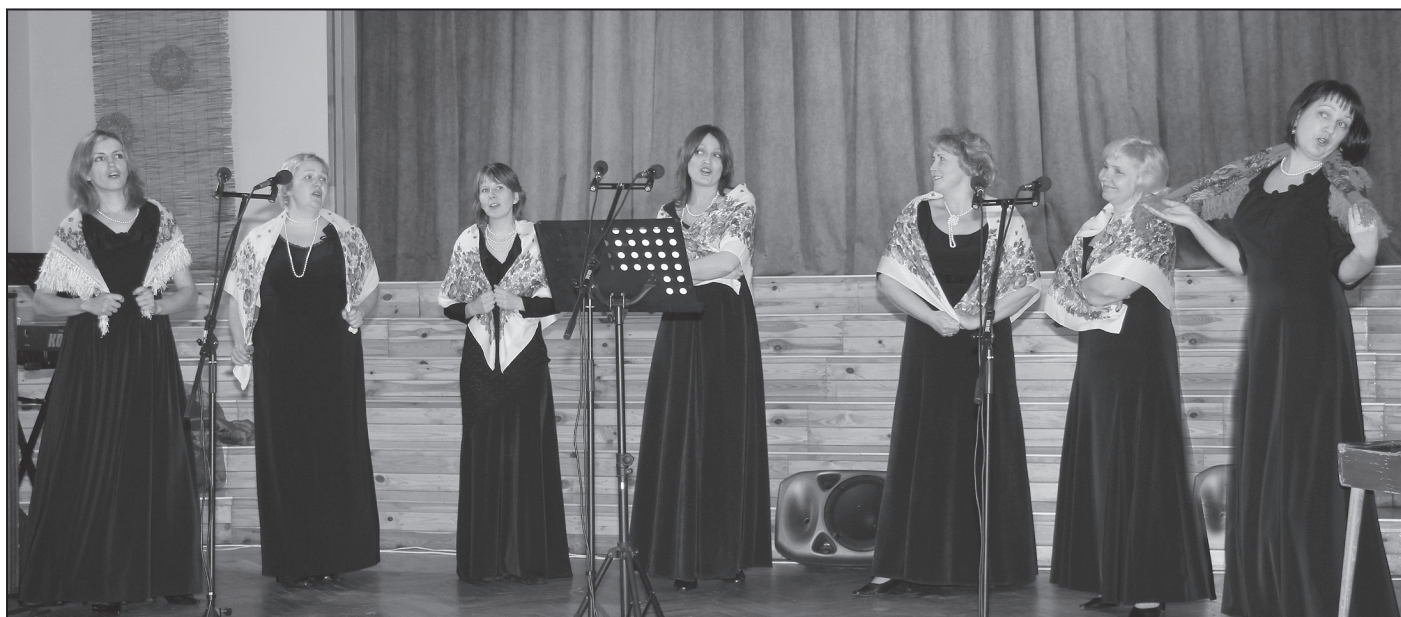
Suntažu kultūras nama vokālais ansamblis "Svīre"