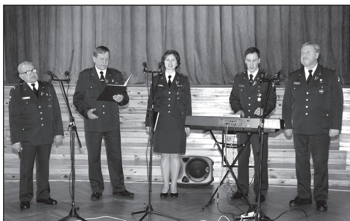
Jelgavas zemessardzes 52. kājnieku bataljona ansamblis "Junda"