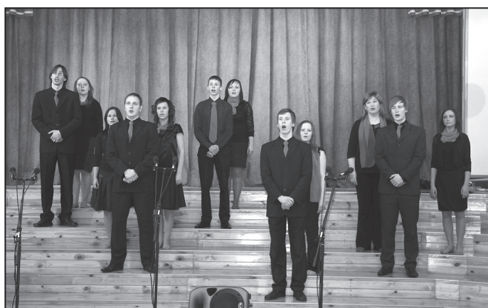
Birzgales tautas nama jauktais vokālais ansamblis "Tikai tā"