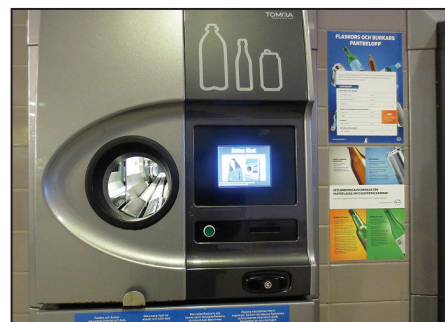
Tukšo pudeļu nodošanas automāts