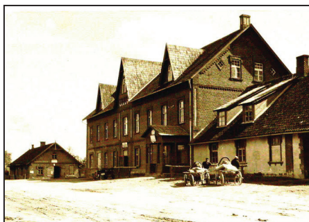
Biedrības nams, iespējams, 20.gs. 30.gadi

Īpašu rakstu veido logi, – otrā stāvā, kur atrodas svētku zāle ar skatuvi un aktieru telpām, fasādes pusē ir astoņi samērā šauri logi, kas vizuāli ēku it kā ceļ uz augšu (ir taču zemnieku atmodas laiks), bet otrā stāva vidējais logs platāks par pārējiem. Ēkas austrumu galā katrā stāvā pa četriem logiem un divi logi jumtgalā. Jumtgalā logus labi var redzēt attēlā, kurā ir vēl divi rombveida sīkrūtoti logi. Logu rūtis augšējā trešdaļā ir sīkrūtotas, bet pārējās loga 2/3 sedz četras četrstūra rūtis.