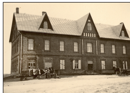
Biedrības nams, iespējams 20.gs. 20. gadi