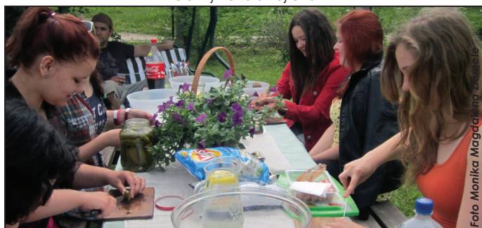
Kopā pavadītais laiks