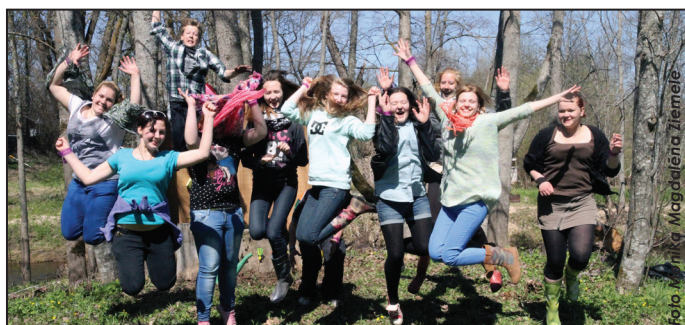
Latvijas Sarkanā Krusta Jaunatnes Suntažu nodaļa