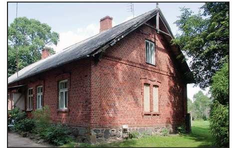
Suntažu pils kompleksa ēka "Blaumaņi"

statistikas pārvaldes lauksaimniecības skaitīšanas dokumentos 1939. gadā ir norādīts, ka divstāvu mūra ēka „Tautas nams” celts pirms 1920. gada. Tas sakrīt ar skolotāja A. Āķa atmiņām un profesionāla arhitektūras speciālista Rīgas Tehniskās universitātes profesora J. Krastiņa atzinuma: „Ēka ir celta pirms pirmā pasaules kara. To norāda būvmateriāli – sarkanie ķieģeļi un ēkas veidols”. Suntažu draudzes lauksaimniecības biedrības nams celts no sarkanīem ķieģeļiem, tāds būvmateriāls ir vēl tagad redzams „Grundulu” mājai, kur tagad ir veikali, Suntažu muižas ēkai – „Blaumaņiem” un citām.