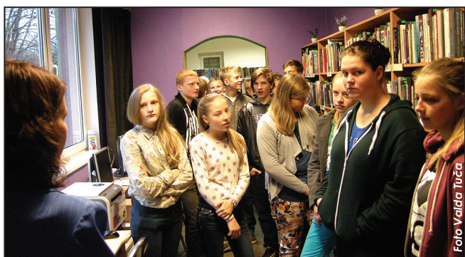
8. klase pagasta bibliotēkā