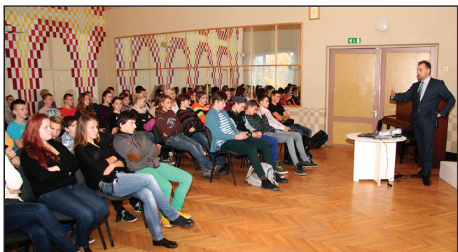
Banku augstskolas lekcija