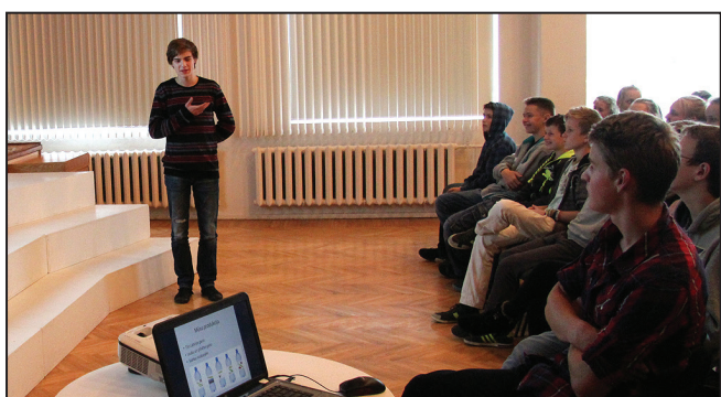
Skolēnu jaundibināto uzņēmumu prezentācija