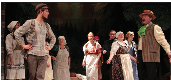
Suntažu amatieru teātris "Sauja"

Latvijas Sarkanā Krusta Suntažu jauniešu nodaļa jau otro gadu pēc kārtas rīko jaunrās sacensības "Gumijnieku skrējieni", kas norisināsies, kā ierasts, 5.maijā, plkst. 12:00, Suntažu estrādes teritorijā un šogad pārsteigs savus apmeklētājus ar 3 dažādu grūtbu trasēm - būs zilā, sarkanā un melnā trase.