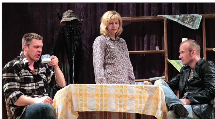
Īles amatieru teātris "Tonis"