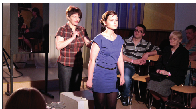
Kokneses amatieru teātris