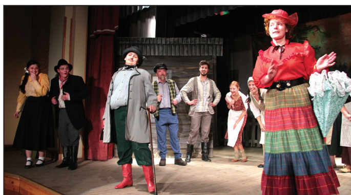
Suntažu amatieru teātris "Sauja"