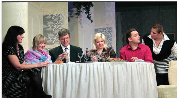
Ķeipenes amatieru teātris "Pūce"