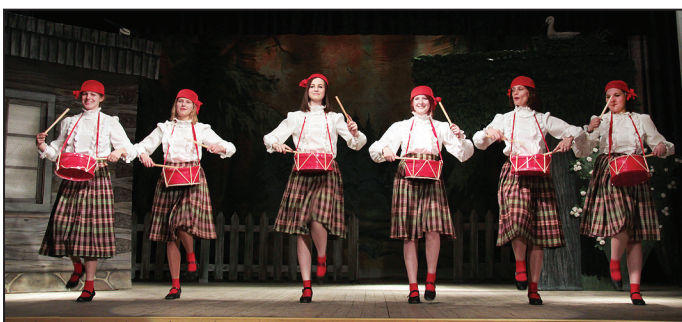
Suntažu amatieru teātris "Sauja"