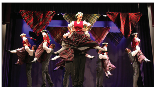
JDK "Zelta Rūsiņš"