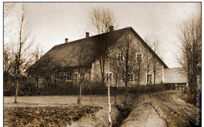
Draudzes skola. /Netālu no "Uceniem./