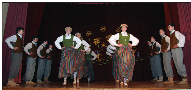
Dejo 9. - 12. klašu jaunieši