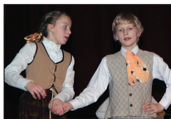
2. - 3. klašu dejojotāji