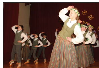
6. - 8. kl. deju kolektīvs