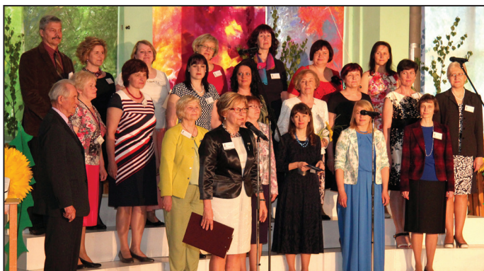
Daļa no patreizējā skolotāju kolektīva

Uz tikšanos skolas simtgades salidojumā!