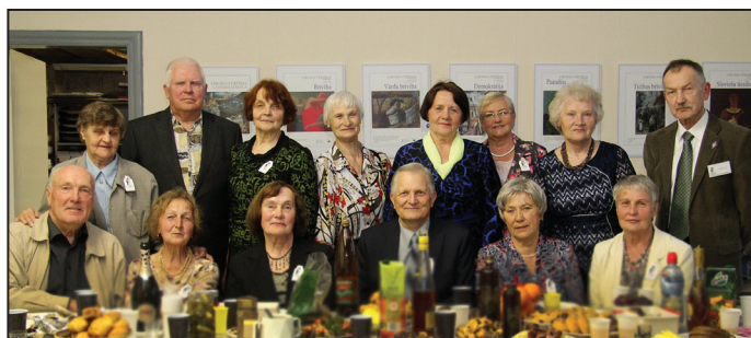
1961. gada vidusskolas absolventi