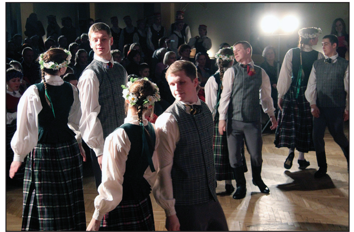
Lauberes kultūras nama jauniešu deju kolektīvs "Spiets"