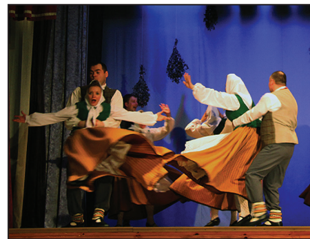
Šalaspils novada VPDK "Ūsa"