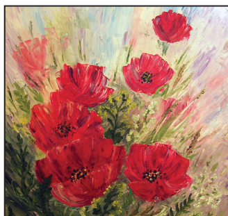
Lolitas Braunas gleznojums