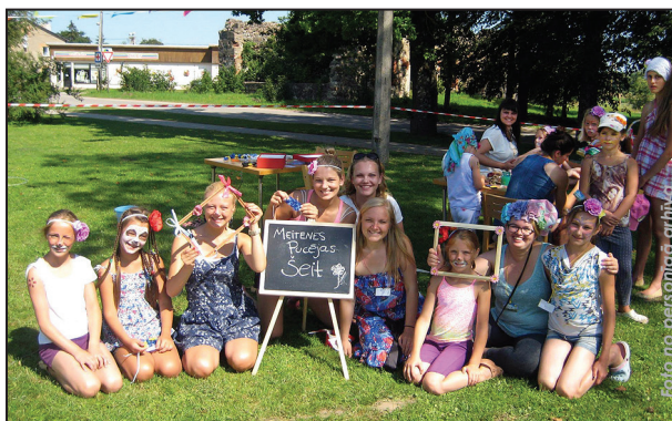
Vasaras nometnē Lauberē

Guvām negaidīti lielu atsaucību no uzrunātajiem uzņēmējiem un uzņēmumiem, kā arī Suntažu sociālā dienesta. Mūsu mērķis nebija tikai praktiskā palīdzība, bet "pleca sajūtas" radīšana, atgādinot cilvēkiem, ka mēs esam tepat blakus un mums rūp mūsu valsts un tās iedzīvotāji. Domāt, ka, aizvedot matu gumijas vai miltu paku, var uzlabot kādam dzīves līmeni, ir diezgan mulķīgi. Apciemot ģimenes un vientuļos pensionārus bija tik emocionāls notikums gan ģimenēm,