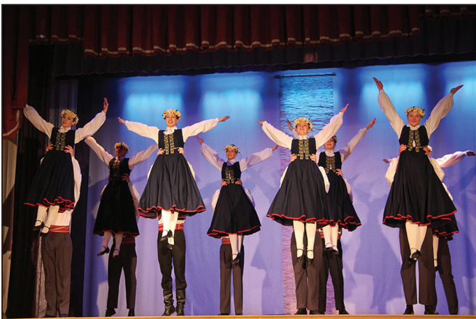
Viļķenes kultūras nama jauniešu deju kolektīvs "Dīdekļis"