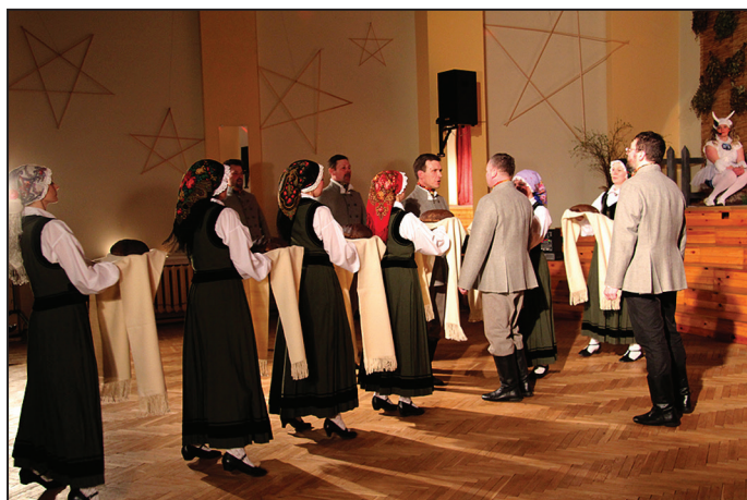
Suntažu kultūras nama VPDK "Sunta"