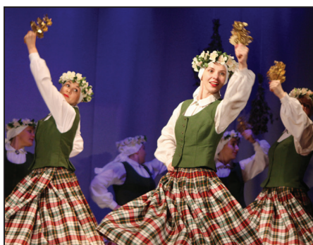
Stopiņu novada VPDK "Stopiņš"