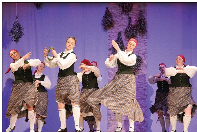
Mālpils novada VPDK "Sidgunda"