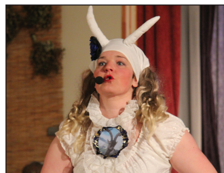
Baltā kaza Barcelona /Guna Ventere/