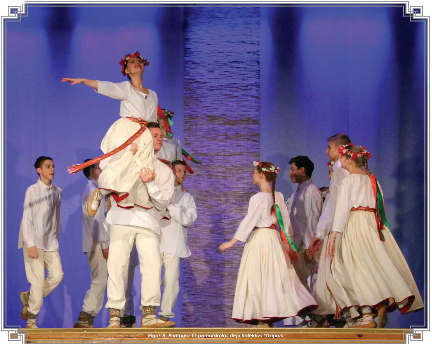
Rīgas A. Pumpura 11.pamatskolas deju kolektīvs "Dzīpars"

Krietnākais līdzeklis dienu labi sākt ir pamostoties padomāt, vai es nevarētu kādam cilvēkam šodien sagādāt prieku.