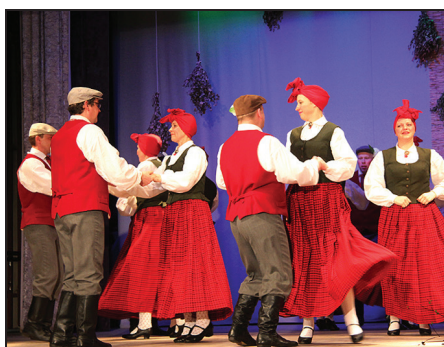
Lauberes kultūras nama VPDK "Lustīgais"