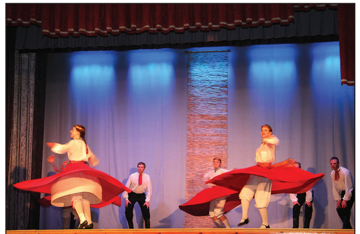
Veselavas tautas nama jauniešu deju kolektīvs