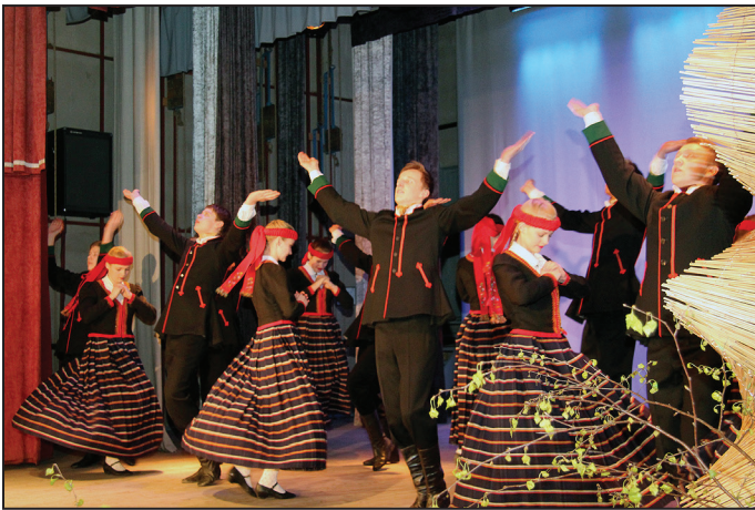
Suntažu kultūras nama jauniešu deju kolektīvs "Spāre"