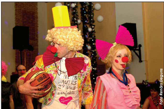
Klauni no vidējās paaudzes deju kolektīva "Sunta"