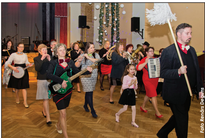
Cirka orķestris - koris "Suntaži"