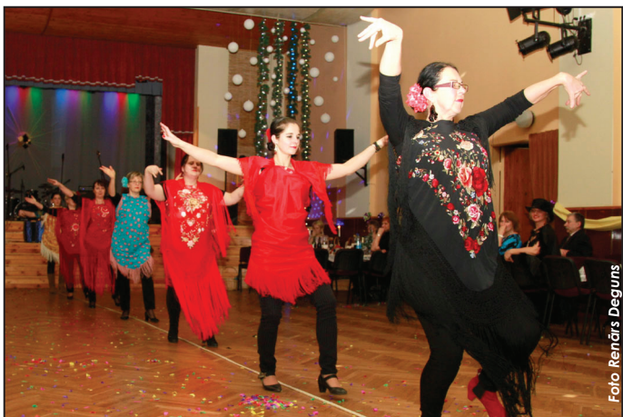
Virves dejojājas no flamenko deju grupas