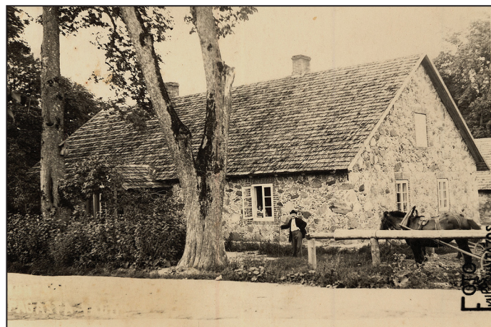
Vecā pagastnama mūra ēka.