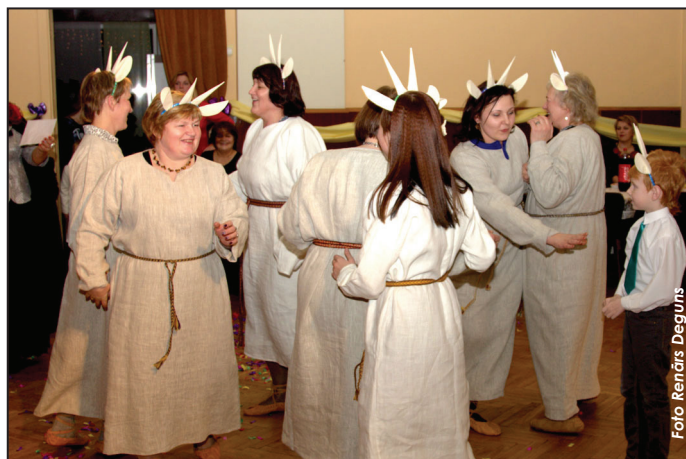
Akrobāti no folkloras kopas "Saule"