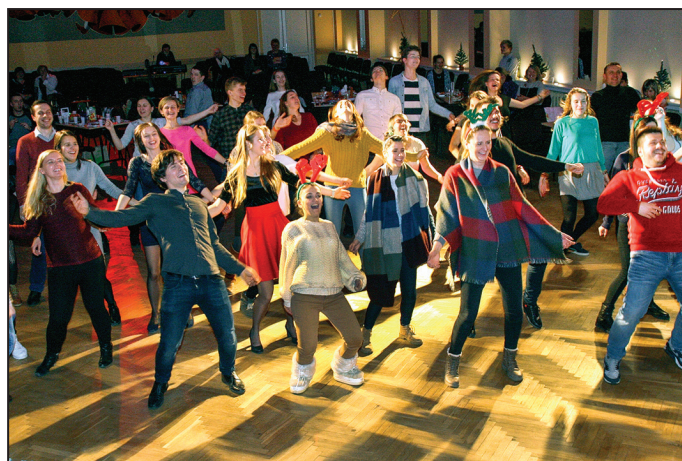
Franču jauniešiem māca pārējiem dalībniekiem deju,