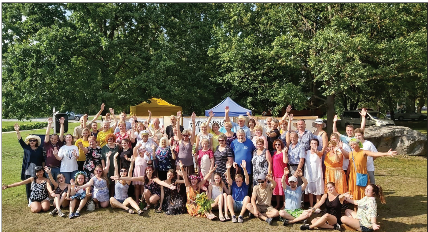
Festivāla dalībnieku kopbilde

Bija izrādes, kuras palika dziļi sirdī. Viena no tām - pēc