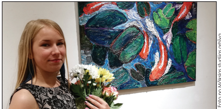
noslēguma darbu aizstāvēšanas dienā 29.05.2019. Ogres Mākslas skolā.