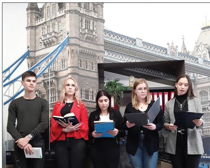
12. klases dzejas lasījumi dzejas pieturā "Suntaži – Londona"