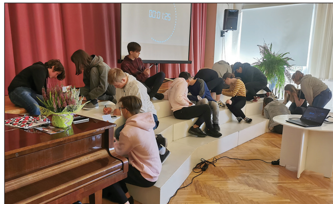
Lekcijas laikā skolēniem bija jāveic arī radošais uzdevums