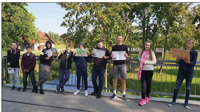
Valodu dienas - Dzejas dienas. 8. klase