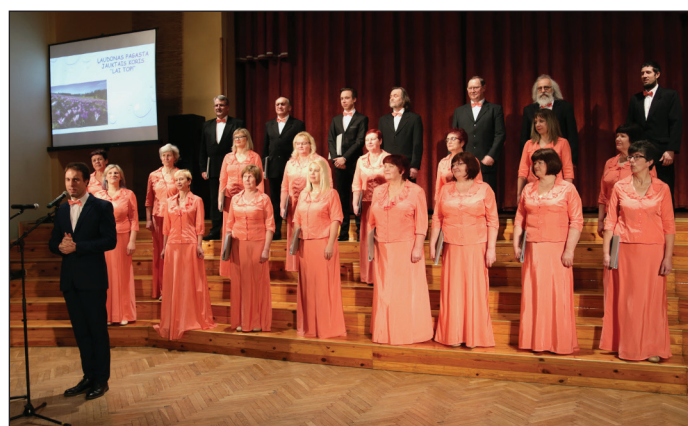
Ļaudonas pagasta jauktais koris "Lai top!"