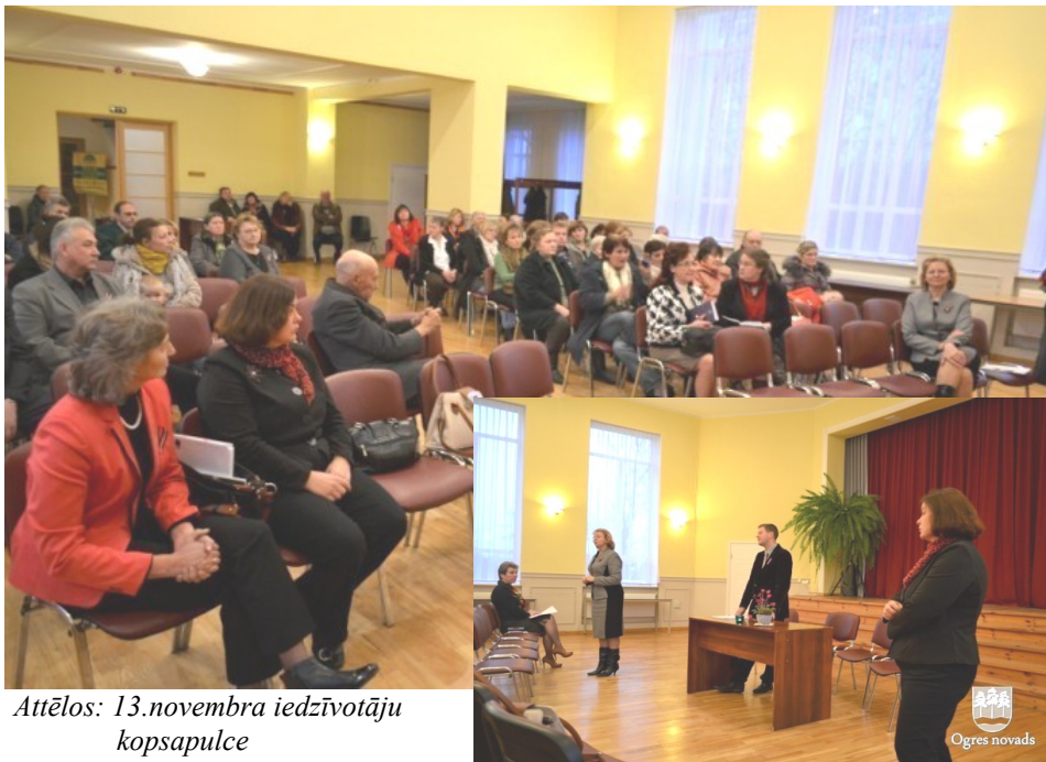
Attēlos: 13.novembra iedzīvotāju kopsapulce

Tā kā saņemam ļoti daudz zvanu no iedzīvotājiem par notikumu virzību Mazozolu un Taurupes pagasta pārvalžu