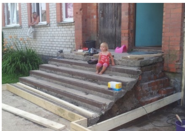
Mājas ieeja pirms...