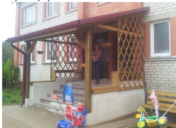
Mājas ieeja pēc...