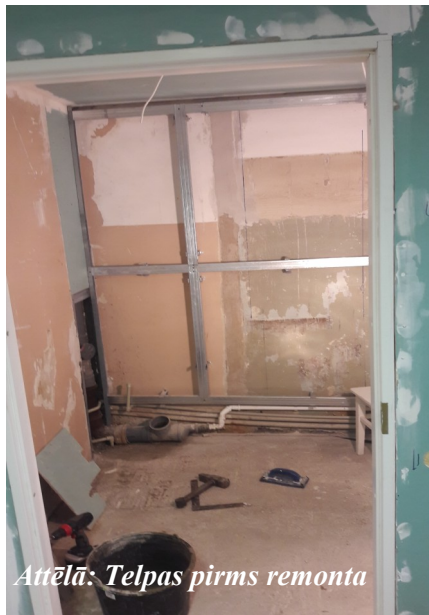
Attēlā: Telpas pirms remonta