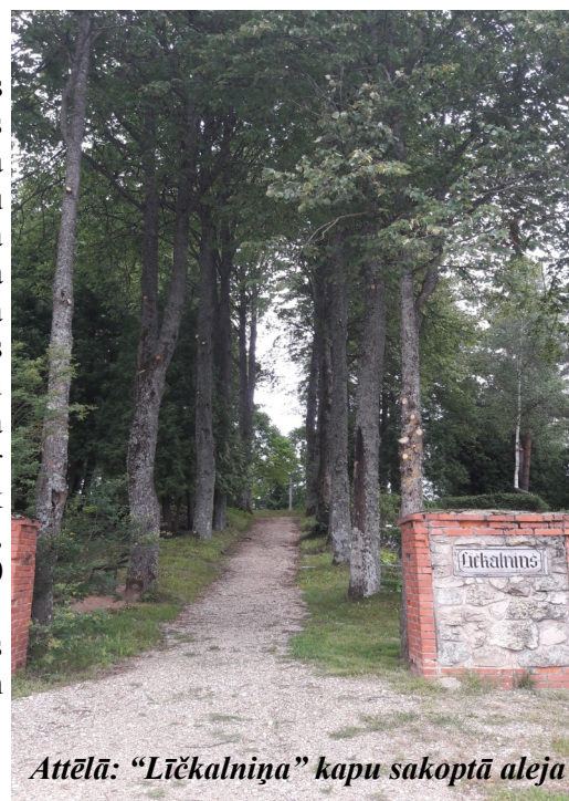
Attēlā: “Līčkalniņa” kapu sakoptā aleja

Priecīgus svētkus vēlot, pārvaldes vadītājs Dzintars Žvīgurs