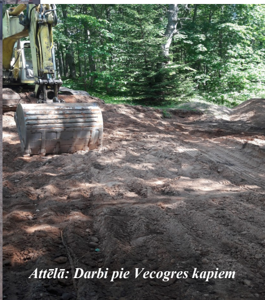
Attēlā: Darbi pie Vecogres kapiem