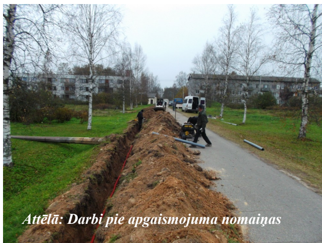
Attēlā: Darbi pie apgaismojuma nomaiņas

Šā gada otrajā pusē, kad dienas paliek īsākas un satumst krietni ātrāk, tika konstatēti elektroapgādes traucējumi Skolas ielas apgaismes ķermeņos. Pieaicinot energospeciālistus un ņemot vērā viņu ieteikumus, kā arī lai padarīto šo ielas posmu