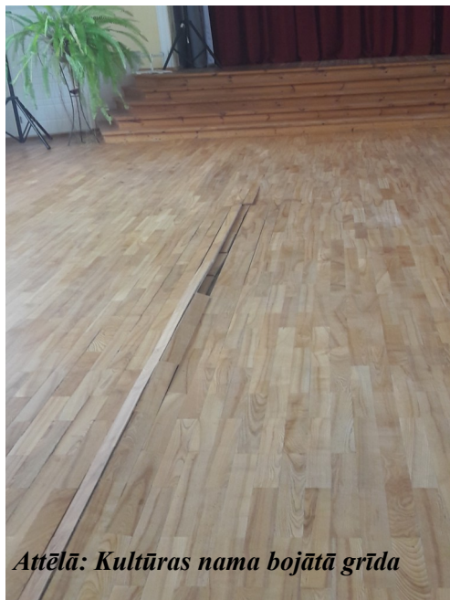
Attēlā: Kultūras nama bojātā grīda

Ne jau vienmēr viss notiek pēc iepriekš sarakstīta scenārija, arī Mazozolu pagastā šogad neiztikām bez problēmsituācijām, proti, šīs vasaras ilgo lietavu dēļ un savulaik “profesionālo” būvnieku daiļrades dēļ, kuri montēja Mazozolu pagasta kultūras nama parketa grīdu, tajā izveidojās lūzuma vieta, kā rezultātā kultūras namu nebija iespējas pilnvērtīgi izmantot, bet tikai ar operatīvu Ogres novada pašvaldības vadības un uzņēmēju gādību 18.novembra Valsts svētku pasākumu varējām sagaidīt un nosvinēt uz Mazozolu pagasta kultūras nama atjaunotās parketa grīdas. Kopējās iepriekš minēto darbu izmaksas sastādīja EUR 3028.21 neieskaitot PVN.