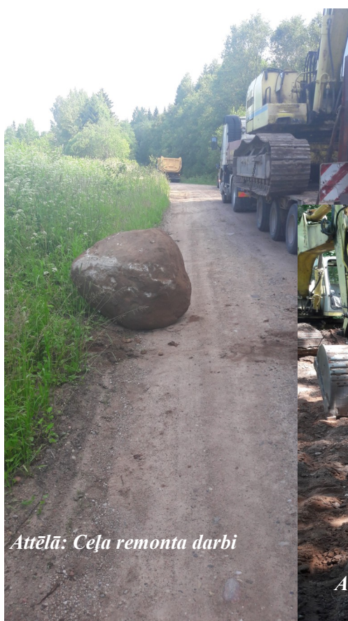
Attēlā: Ceļa remonta darbi