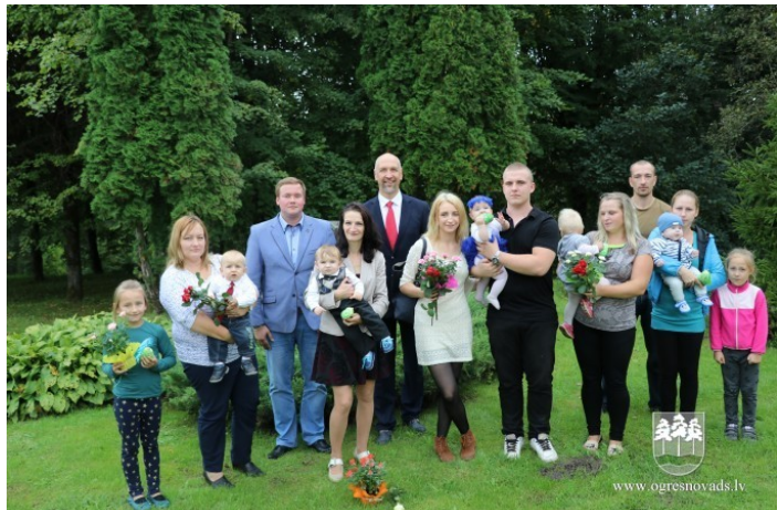
Attēlā: Mazozolu pagasta jaunās ģimenes un vadības pārstāvji