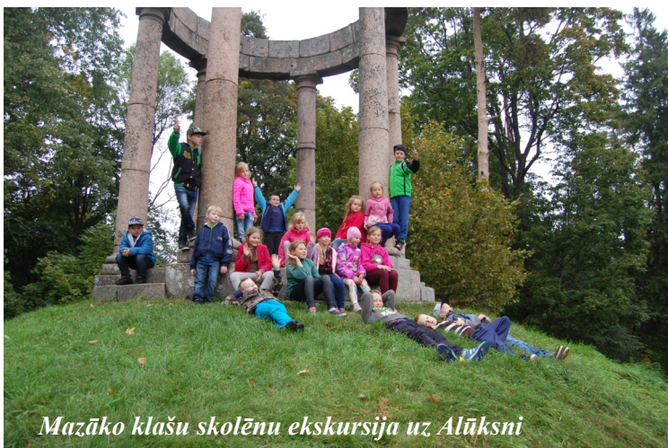
Mazāko klašu skolēnu ekskursija uz Alūksni