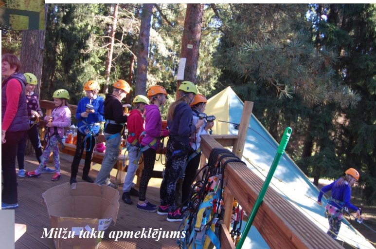
Milžu taku apmeklējums

Mēs visa skola bijām uz Milžu takām - tur bija ļoti interesanti. Mēs tur bijām kā tarzāni. Tas bija ļoti jautri un baismīgi. Man no sākuma bija ļoti, ļoti bail, rokas un kājas trīcēja. Pēc tam aizgāja un gāju kā mašīna.