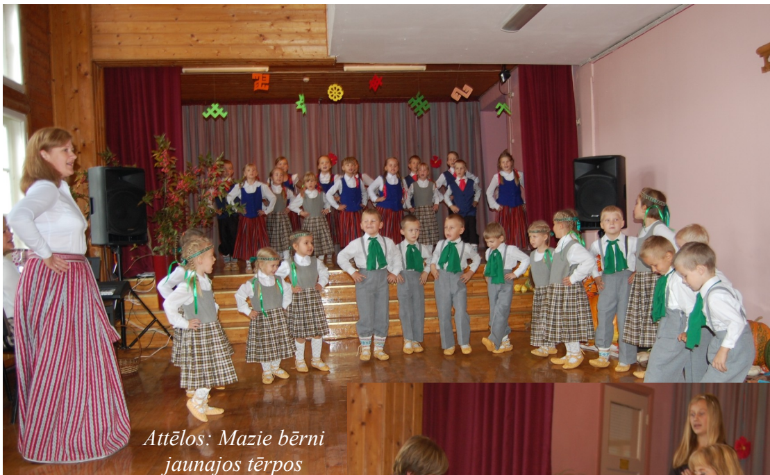
Attēlos: Mazie bērni jaunajos tērpos