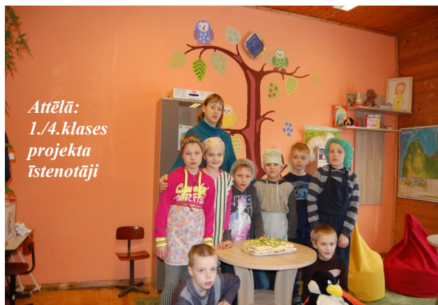
Attēlā: 1./4.klases projekta īstenotāji

Paldies mūsu vecākiem par palīdzību un izdomu!