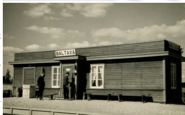
Baltavas stacija 1939.gadā