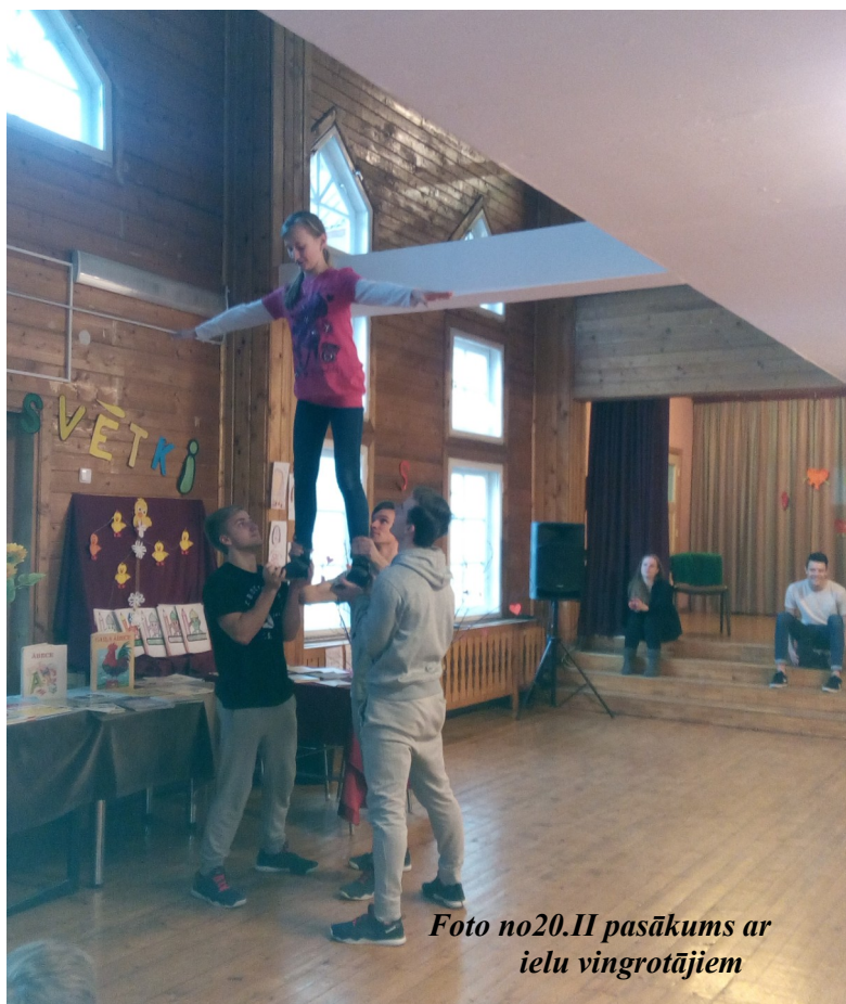
Foto no 20.II pasākums ar ielu vingrotājiem

• 28.II Diagnosticējošo valsts pārbaudes darbu matemātikā kārtoja 6.klases skolēni .