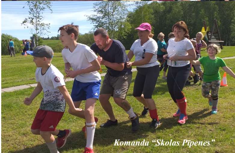
Komanda "Skolas Pīpenes"