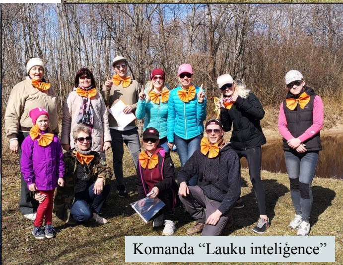
Komanda "Lauku inteliģence"