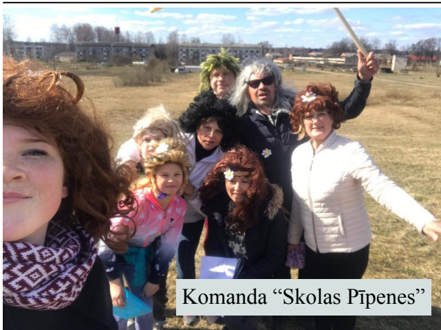
Komanda "Skolas Pīpenes"