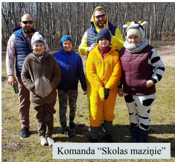
Komanda "Skolas maziņie"