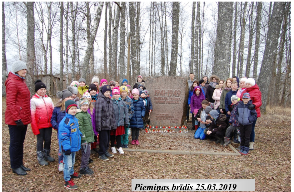
Piemiņas brīdis 25.03.2019

Te ir tā vieta, kur atkal un atkal aicina sirds. Te ir tā birztiņa, pagalmis un aka, mūžam, kas neaizbirst. Te ir tā vieta, spārni kur auga, ligzda, ko šūpoja bērzs, Te no šī tīruma, te no šī lauka iesākās vērtību mērs. Te, kur liesmu sedzot ar plaukstu, piemiņas svečīti likt... Vieta, kur pārnākt, vienalga, cik augstu, vienalga, cik tālu tikt.