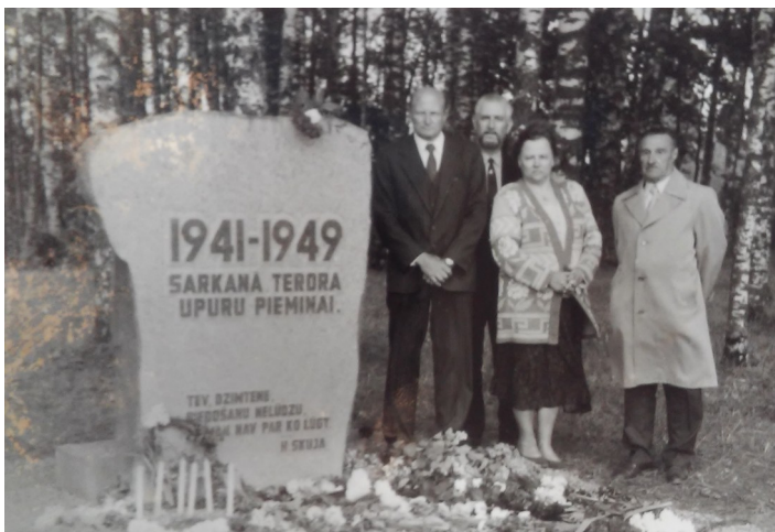
1941.gada 14.jūnijā represētie (Pieminekļa atklāšana 1991.g.)

Deportētajiem atgriezties dzimtenē ļāva tikai pēc Staļina nāves (1953.). Līdz 1963.gadam Latvijā bija atgriezušies apmēram 31 600 cilvēku. Izsūtīšana sasniedza savu mērķi- zemnieki, represiju iebaidīti, sāka stāties kolhozos- nebija citas izejas, lai paliktu uz dzīvi savās mājās