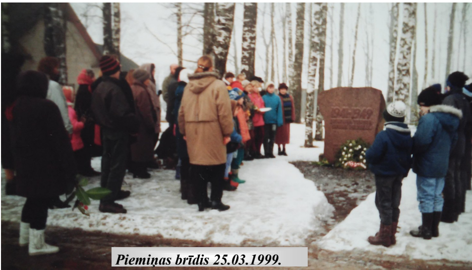
Piemiņas brīdis 25.03.1999.