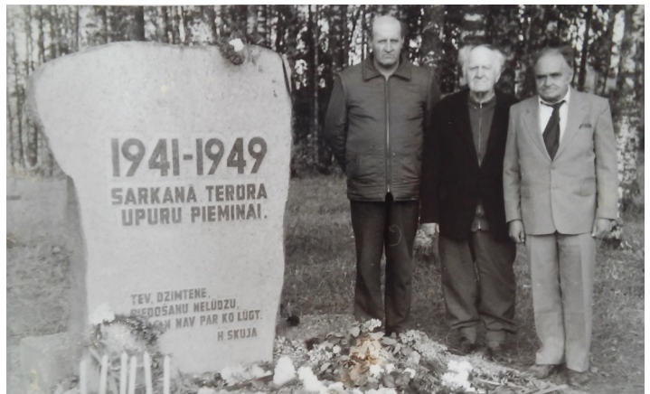
1949.gada 25.martā represētie (Pieminekļa atklāšana 1991.g.)

Norādījumus par deportāciju 24.marta vakarā saņēma īpaši norīkoti čekas pagastu pilnvarotie un to uzticamākie palīgi- komunisti un komjaunieši, kas veidoja ap pusi tiešo izpildītāju. Par katru izsūtāmo ģimeni bija sagatavota “lieta”, kurā atradās dokumenti: arhīva ziņas par “kulaka” saimniecības lielumu 1939. gadā, apliecinājums par ieskaitīšanu “kulaku” ģimeņu sarakstos kopš 1947.gada, izziņa par to, vai kāds no izsūtāmajiem ir dienējis Sarkanarmijā, aptaujas lapa par ģimenes sastāvu. Bez “kulakiem” deportēšanai pakļāva arī “bandītu”, “nacionālistu” un citu “tautas ienaidnieku” ģimenes, starp tiem arī tos, kam bija palaimējies atgriezties no iepriekšējiem izsūtījumiem, īpaši- jauniešus un bērnus.