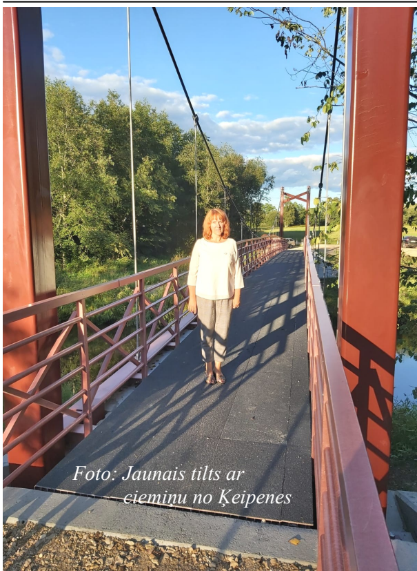
Foto: Jaunais tilts ar cieminu no Ķeipenes