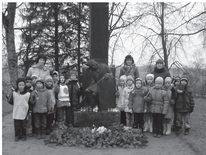
Pie pieminekļa Madlienas brīvības cīnītājiem